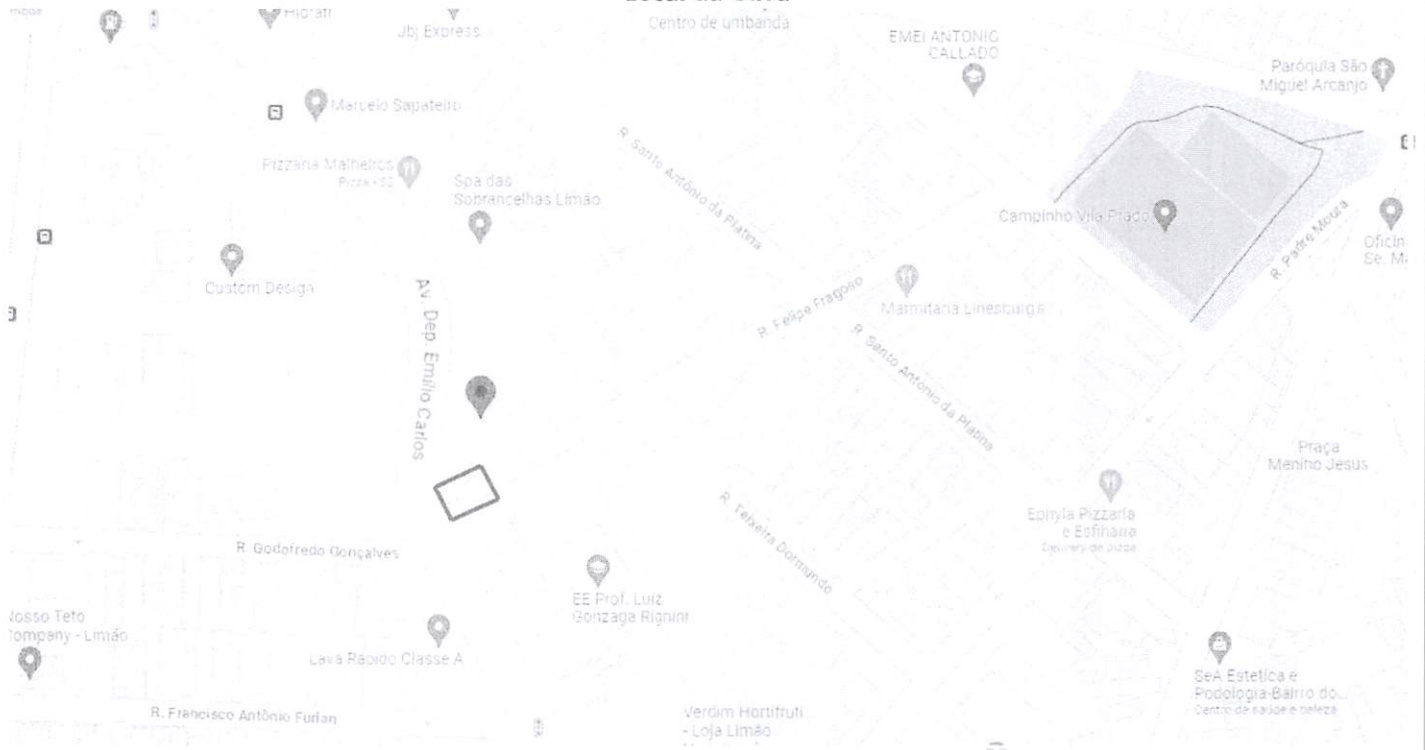
FOTO AÉREA Local da Obra