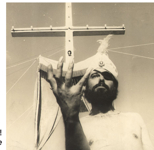
Cinema: Vem Kafka na Mário! Profeta da Fome