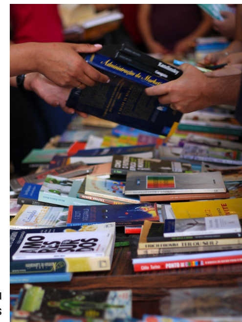
Feira de Troca de Livros