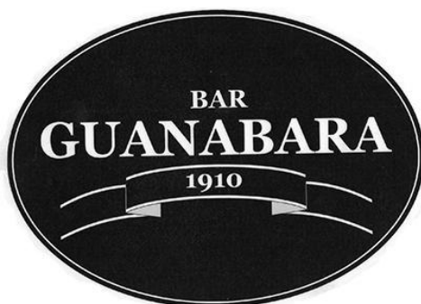
Antiga logomarca do Bar Guanabara.