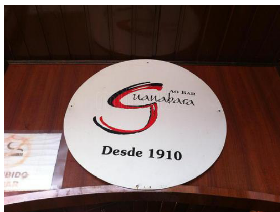
Atual logomarca do Bar Guanabara.