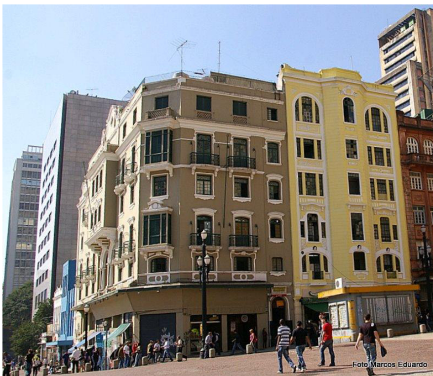
Fachada do Edifício José Moreira. No térreo, funciona o Bar Guanabara. Autor: Marcos Eduardo. Sem data. Disponível em http://bellapauliceia.com.br/exibeMateria.aspx?id=103 Acesso em julho de 2016.