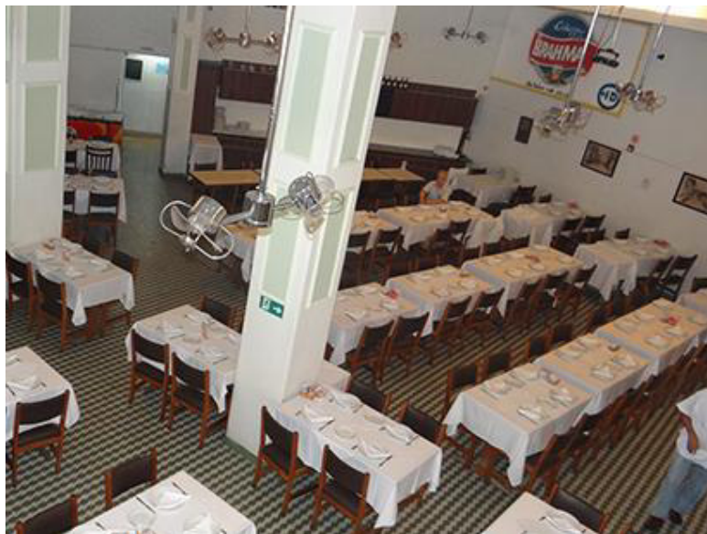
Vista do salão a partir do mezanino. Fonte: Guia Onde. Sem data.