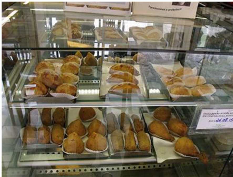
O balcão de salgados – uma das tradições da casa – está posicionado na entrada. Fonte: Guia Onde. Sem data.