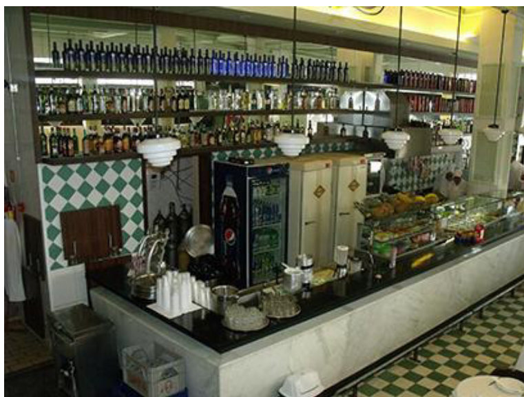
Vista do bar. Sem data.