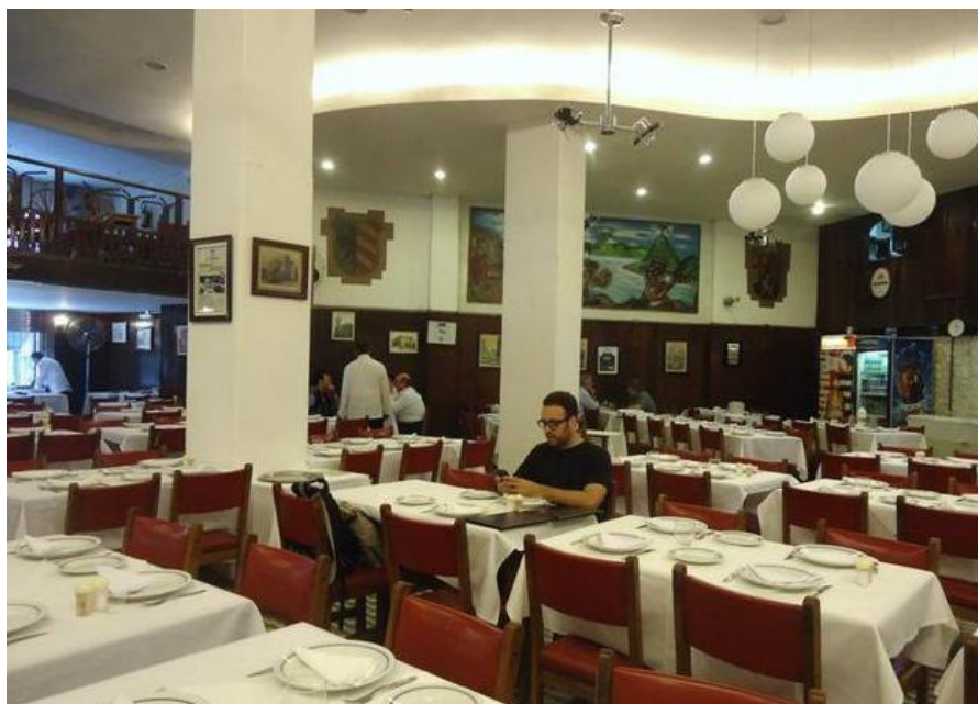
Aspecto do salão do Bar Guanabara.