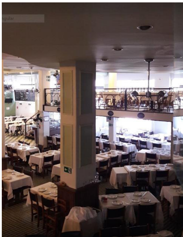
Aspecto do salão do Bar Guanabara. Ao fundo, o mezanino.