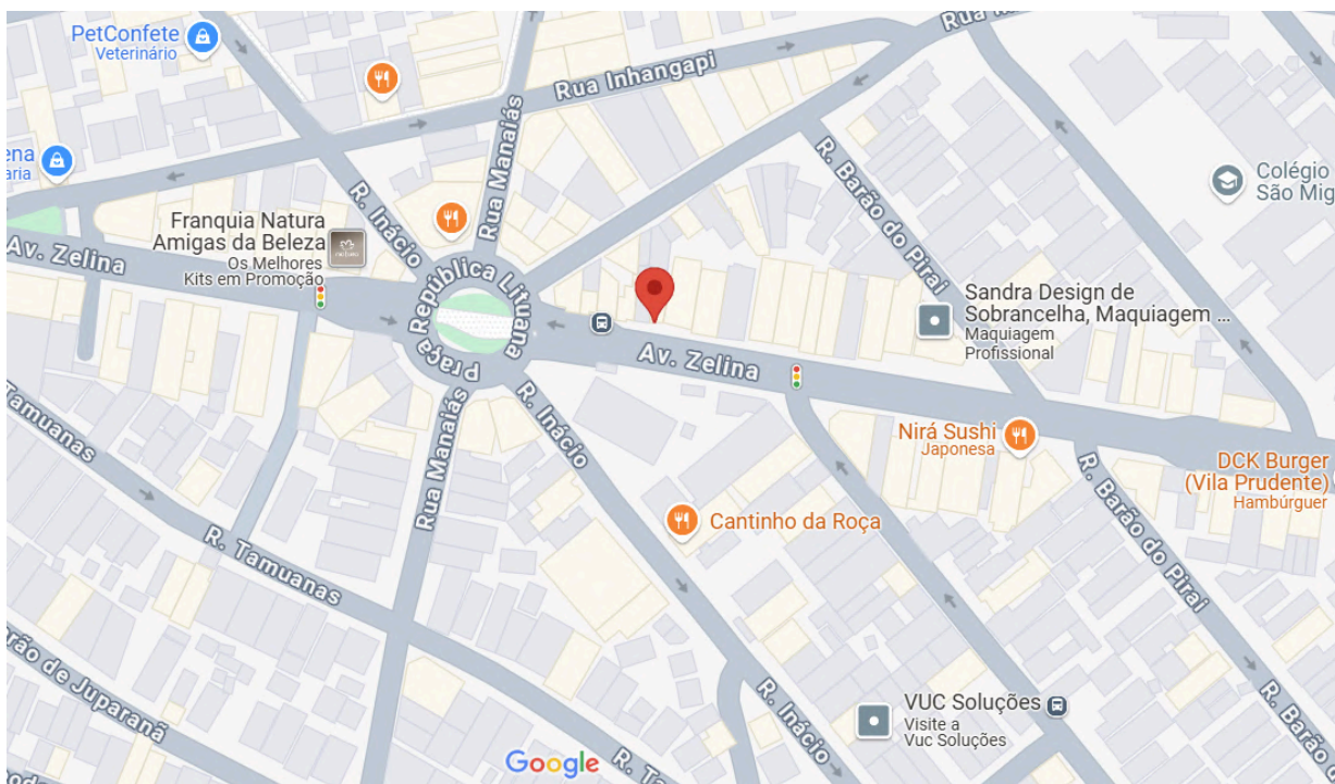
Localização do Bar do Vito . Fonte: Google Maps, 2025. Acesso em: 29 de janeiro de 2025.