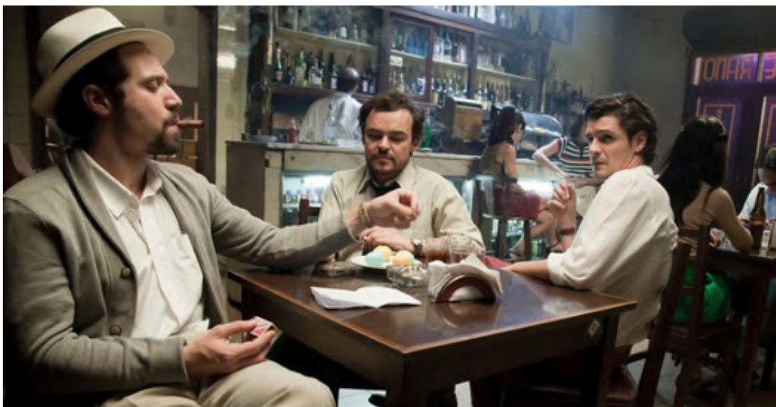
Imagem da Série Zé do Caixão no Bar do Vito, 2015. Fonte: Ana Ottoni. Disponível em: https://televisao.uol.com.br/album/2015/04/17/veja-cenas-da-serie-ze-do-caixao.htm?fbclid=IwY2xjawH_QXRleHRuA2F1bQlxMQABHVbqxqKk3DuKb60u2KB9W1dgkIEZB_hQ1ro417DdefgLRKligAEkZEu1eQ_aem_HOU4_E0yWD7J5-Oc4kxrLA#fotoNav=6 . Acesso em: jan. 2025.