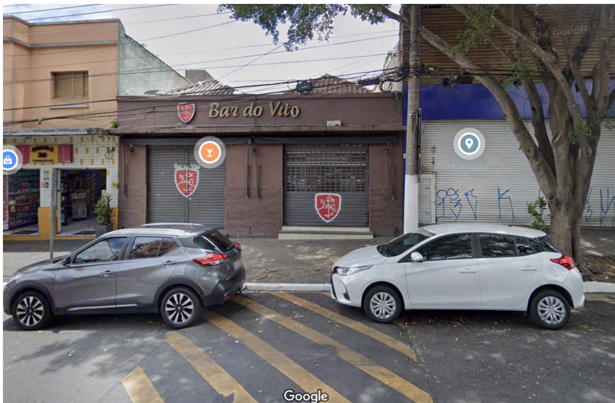
Fachada do Bar do Vito . Fonte: Google Street View, janeiro de 2024. Acesso em: 29 de janeiro de 2025.