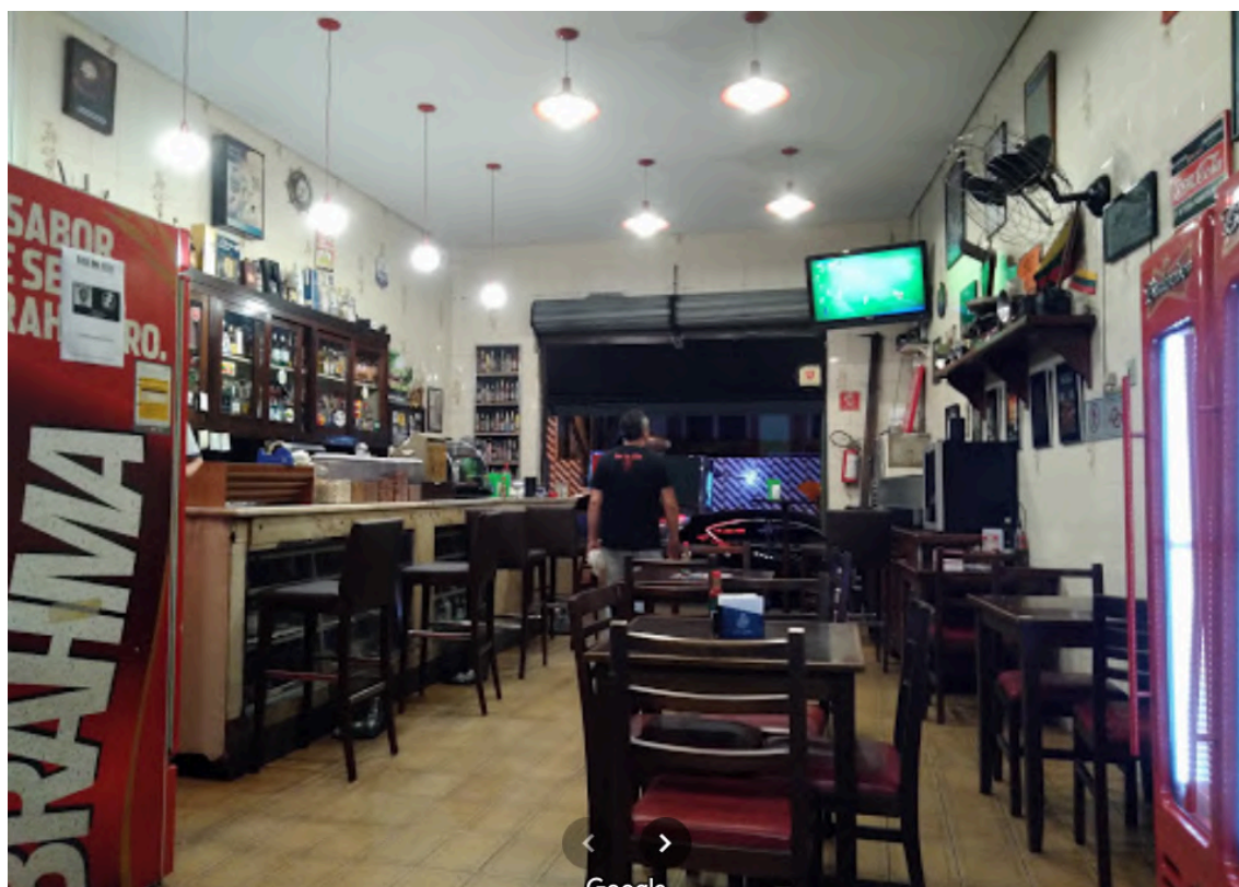
Interior do bar, em julho de 2019.