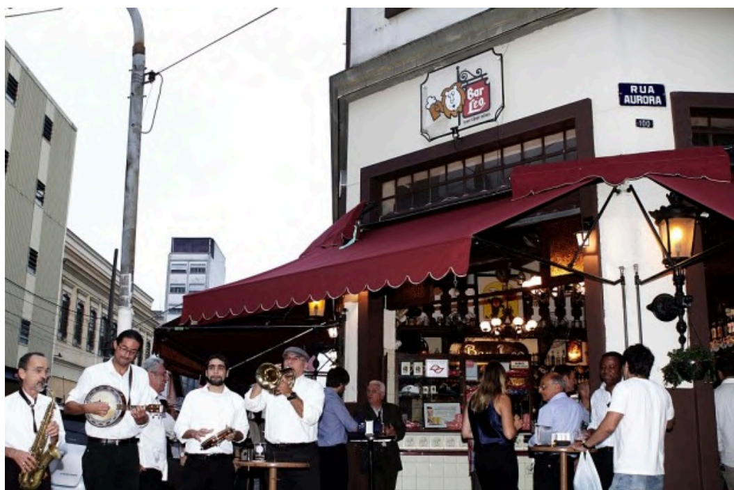
Fotografia da entrada. Janeiro de 2013. Disponível em: < https://bardocelso.com/bar-do-leo-ganha-premio-de-melhor-historia-de-boteco-do-pais/ >. janeiro de 2025.