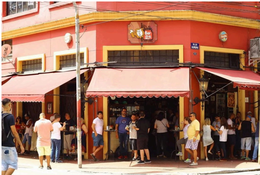
Fotografia da entrada. Autor desconhecido. Sem data. Disponível em: < https://www.barleo.com.br/rua-aurora-sp-1 >. Acesso em: janeiro de 2025.