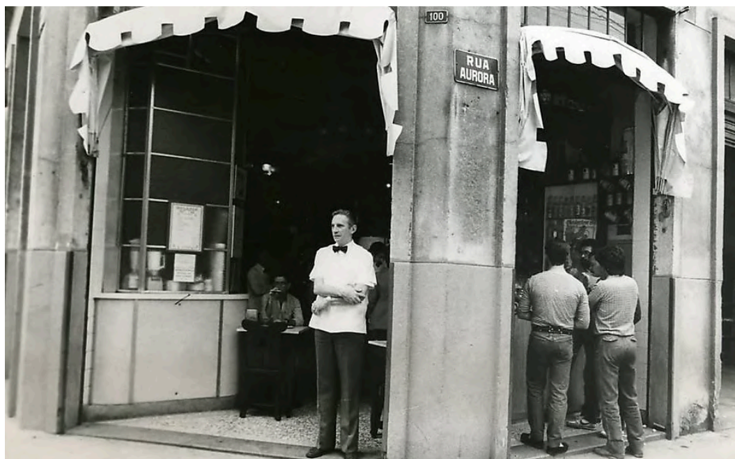
Fotografia da entrada do bar. Setembro de 1984.