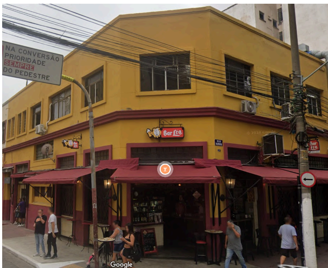
Fachada do Bar Léo .