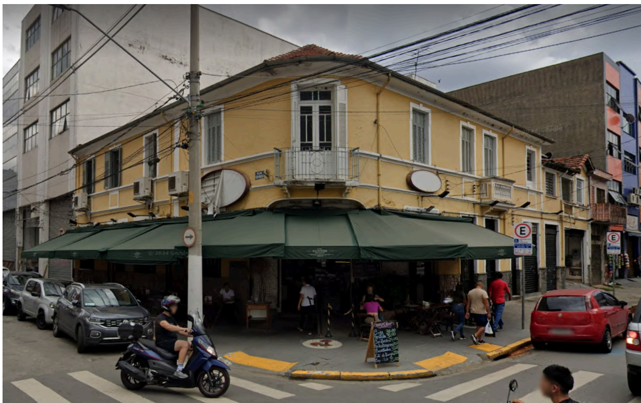
Fachada do estabelecimento Casa Santos . Fonte: Google Street View, abril de 2024. Acesso em: 28 de janeiro de 2025.