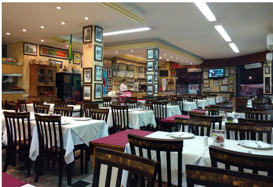
Salão da Casa Santos.