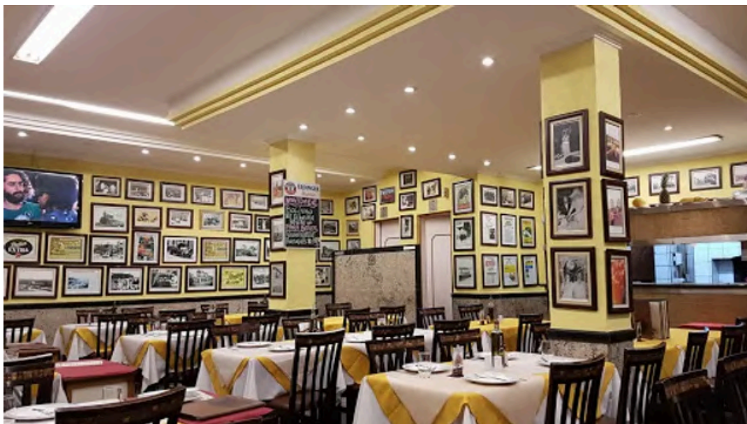
Ambiência interior do Restaurante