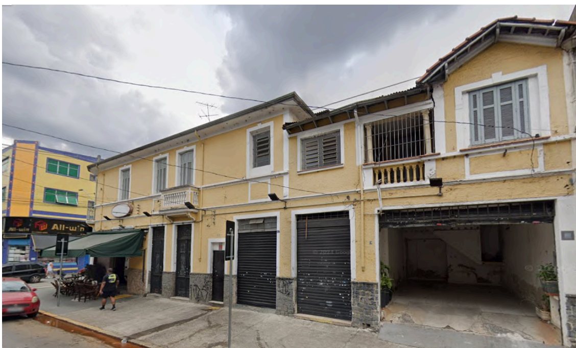
O imóvel do Restaurante Casa Santos, localizado na Rua Conselheiro Dantas, números 74, 82, 86, 88 e 92. Fonte: Google Street View, 2024. Acesso em: 28 de janeiro de 2025.

O imóvel que ocupa o restaurante foi, também, o de residência da família Santos. Sua presença no bairro pode ser rastreada desde o ano de 1925, quando o patriarca Joaquim dos Santos adquiriu a propriedade na Rua Conselheiro Dantas 93 . O prédio teve sua ampliação aprovada em 1927, conforme relata o expediente da prefeitura em 3 de outubro 94 . Até 1957, a família ainda morava no sobrado no qual funciona o restaurante 95 .