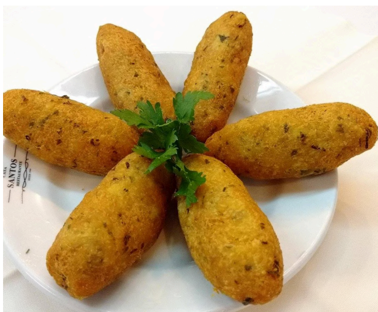
Bolinhos de bacalhau da Casa Santos.