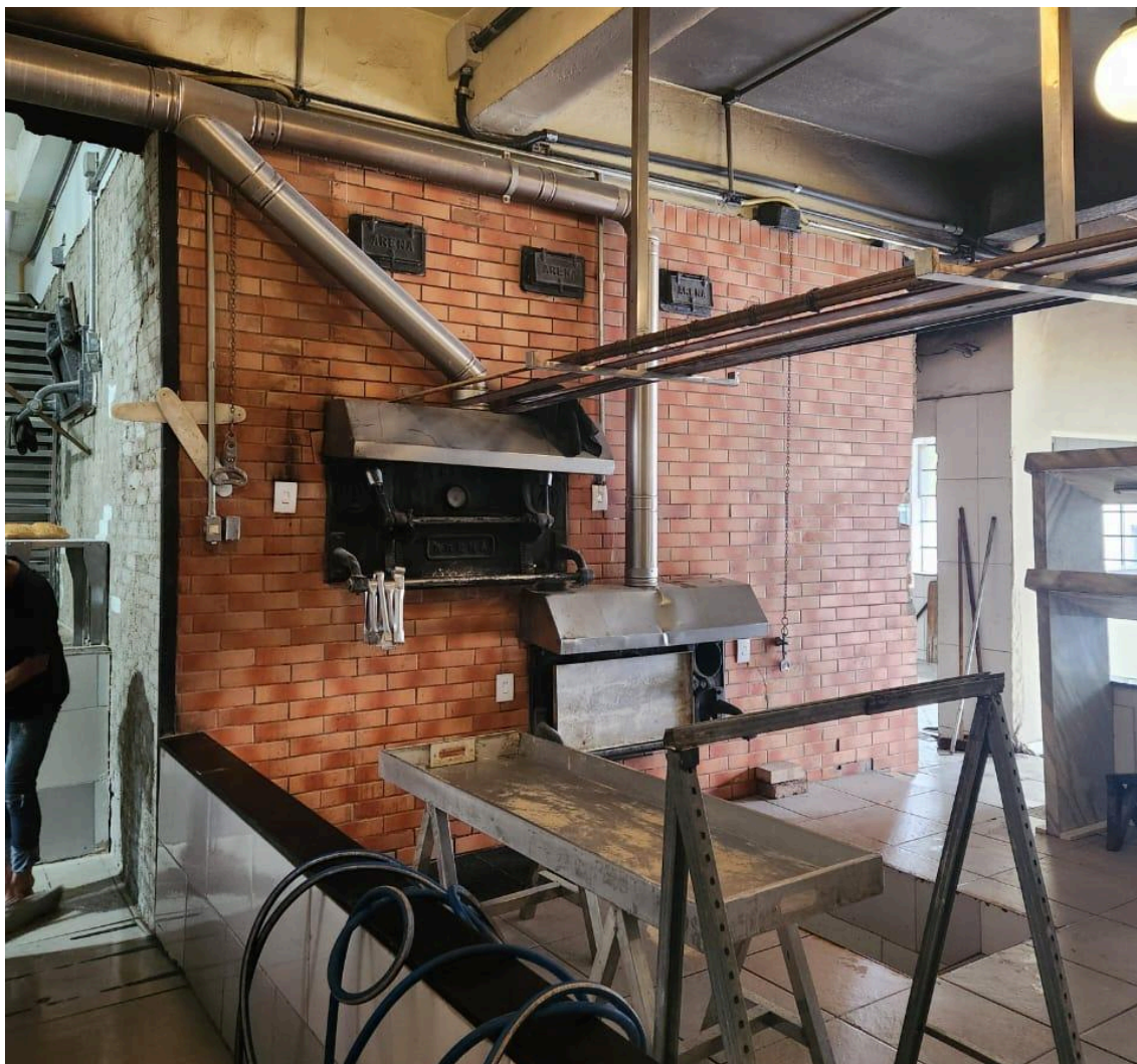
Forno à lenha original, onde os pães continuam sendo assados até hoje. Foto: Marina Gregori Tokita, em 27 de janeiro de 2025.

Ademais, há nas paredes e em algumas bancadas fotos, notícias e objetos antigos da família Carillo, que remontam a história do lugar e atestam sua tradição.