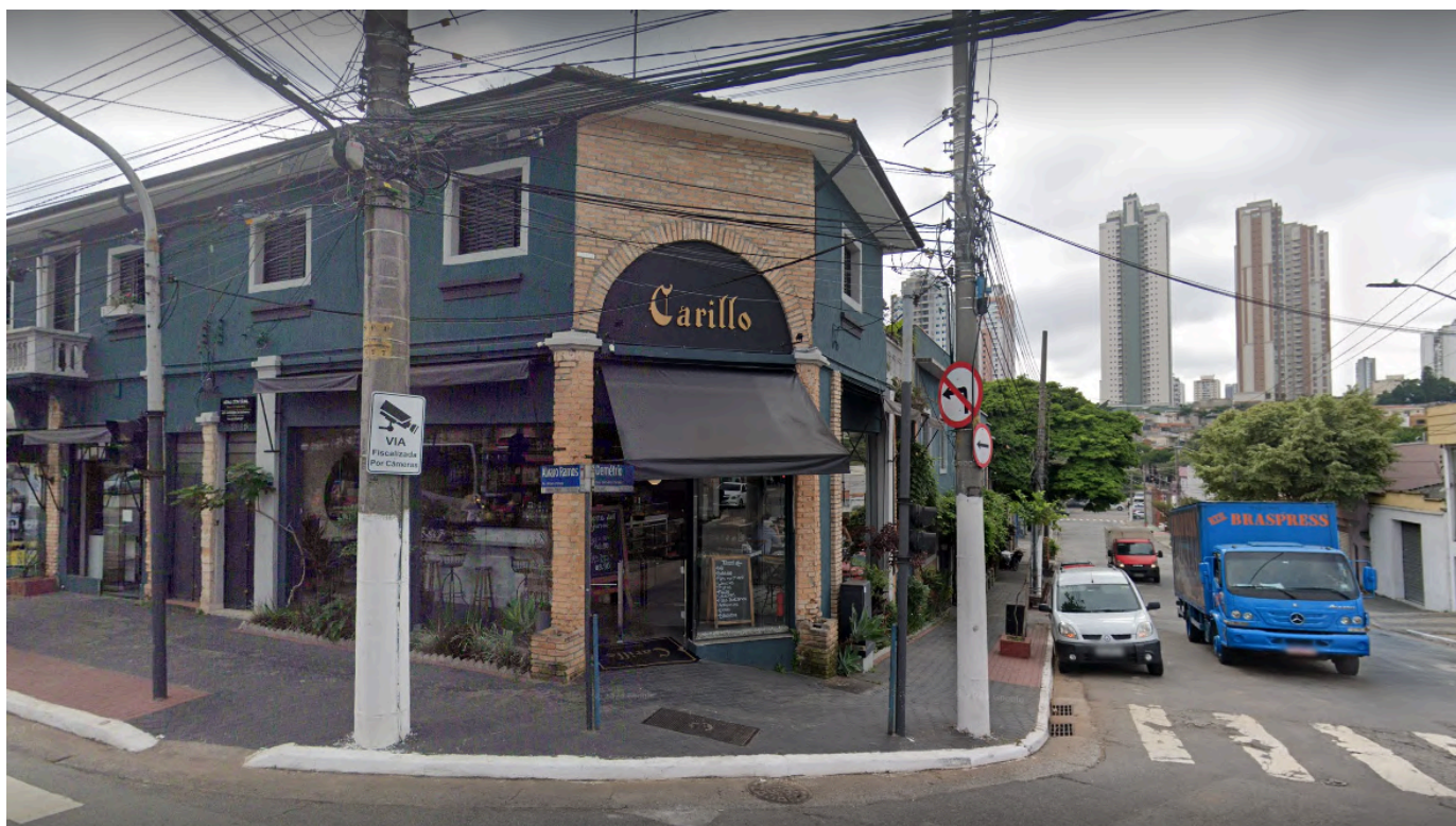
Fachada da Padaria Carillo .