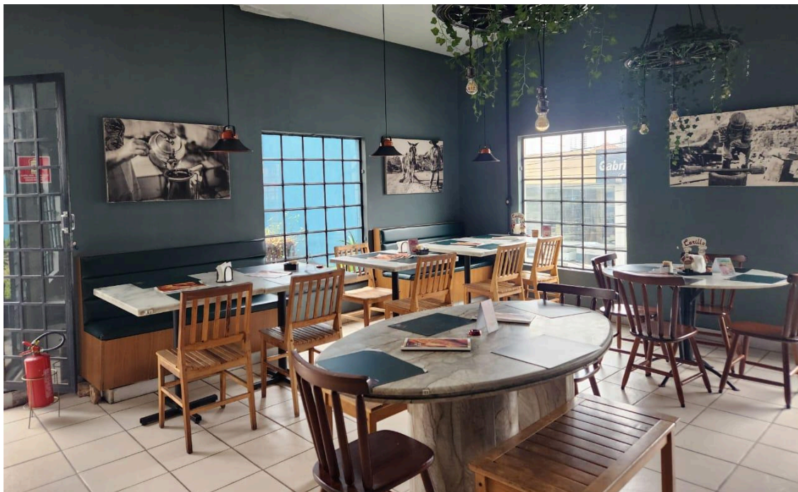
Salão novo e reformado da Padaria Carillo. Foto: Marina Gregori Tokita, em 27 de janeiro de 2025.

Por essa mudança, o espaço do salão é uma construção recente e moderna. Apesar disso, foi informado pela gerência que houve certo cuidado em manter uma atmosfera italiana nessa parte reformada, como as paredes e as mesas de mármore.