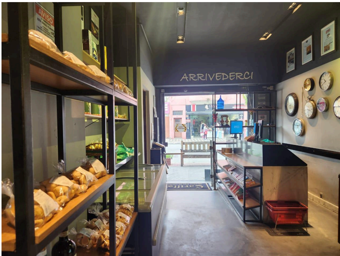
Parte de mercearia da Padaria Carillo. Foto: Marina Gregori Tokita, em 27 de janeiro de 2025.

mercearia, na qual são vendidos produtos diretamente importados da Itália, como sucos, molhos e conservas, assim como alguns doces caseiros.