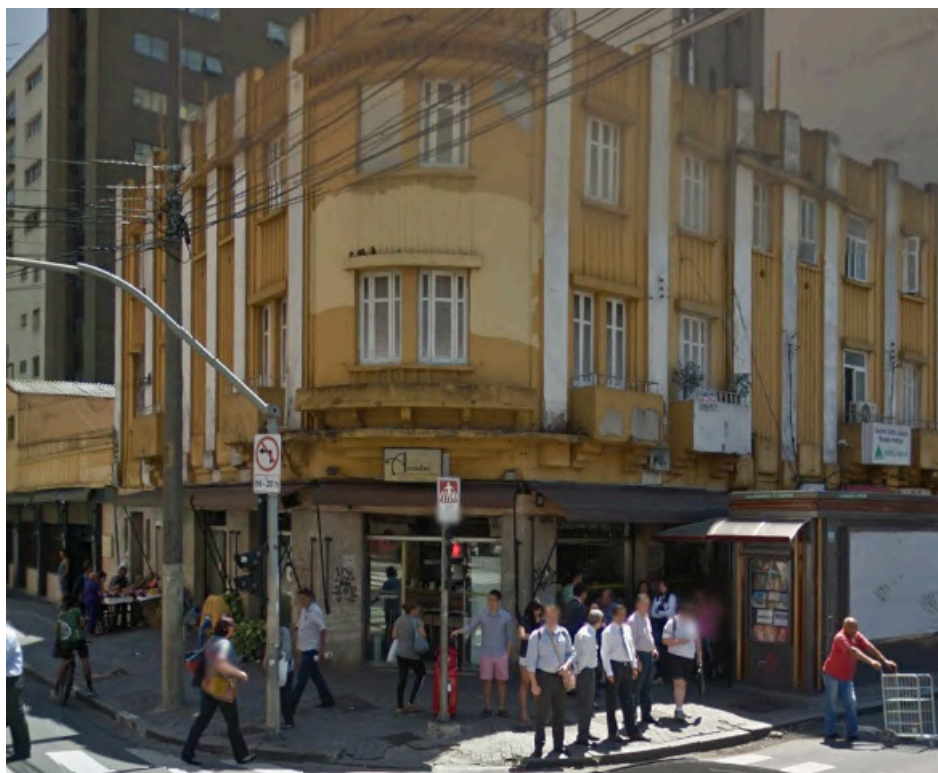
Fachada da Padaria Arcadas .