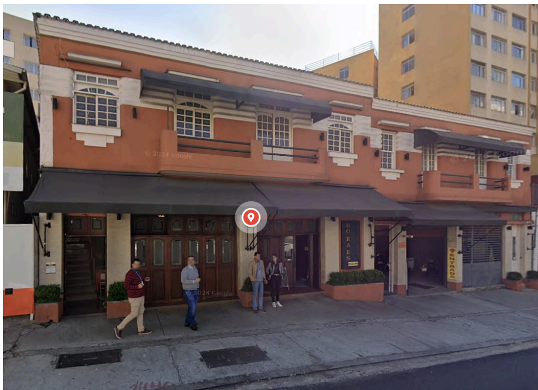
Fachada da Pizzaria Moraes . Imagem capturada pelo Google Street View em julho de 2024. Acesso em janeiro de 2025.