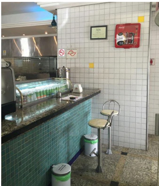
Bancada da lanchonete da Lanchonete & Pizzaria Real anterior à reforma.