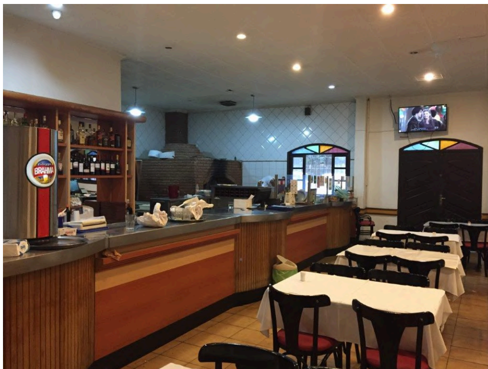
Salão interno da pizzaria da Lanchonete & Pizzaria Real anterior à reforma. Disponível em: < http://leamezher.com.br/real-pizzaria/ >. Acesso em: janeiro de 2025.