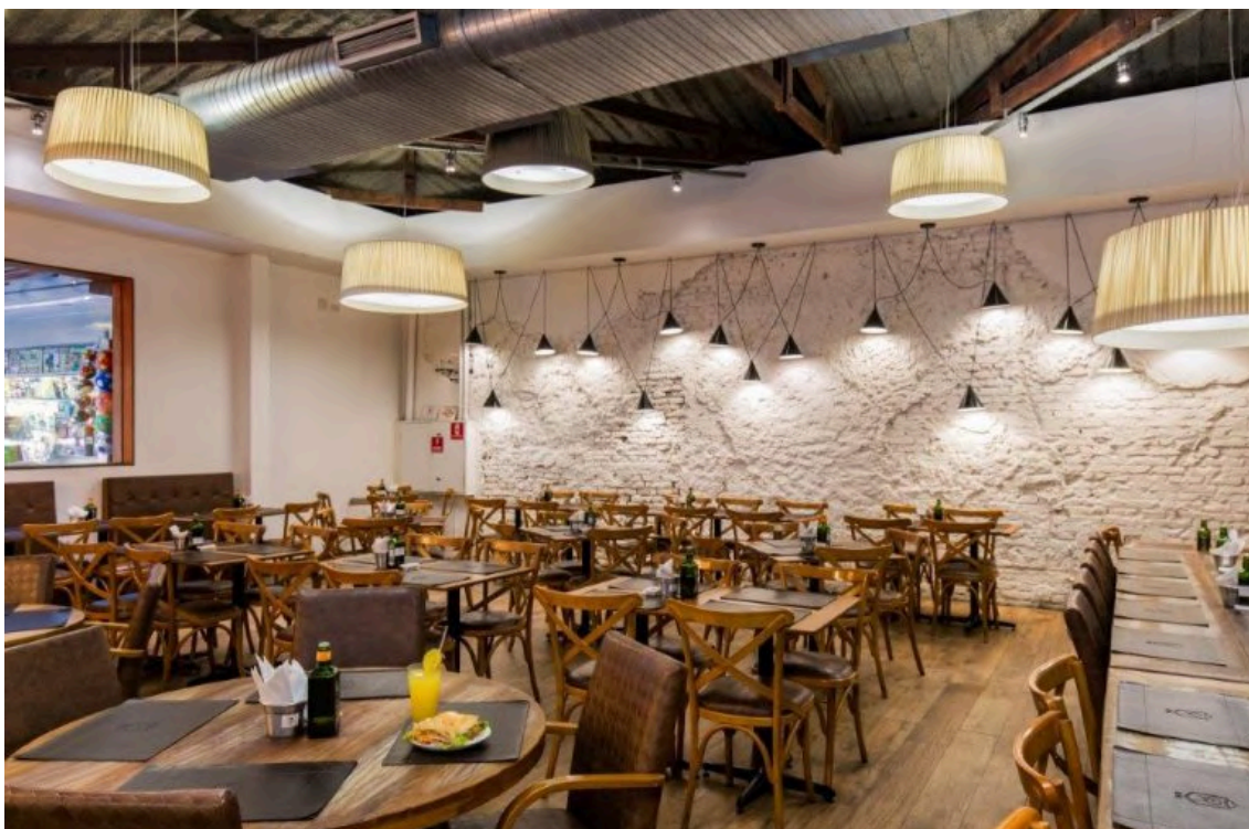
Área interna da pizzaria após a reforma. Disponível em: < http://leamezher.com.br/real-pizzaria/ >. Acesso em: janeiro de 2025.