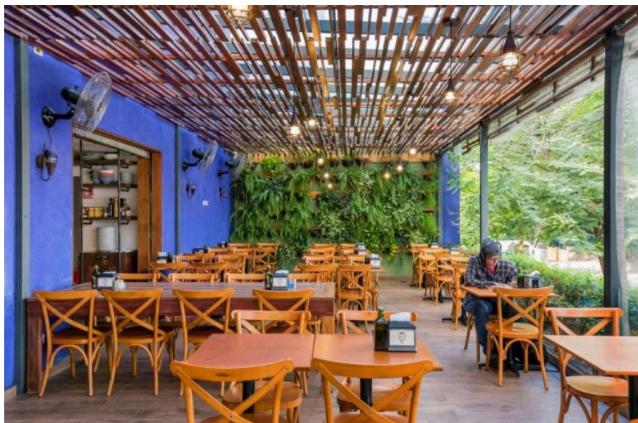
Área externa do estabelecimento, após a reforma. Disponível em: http://leamezher.com.br/real-pizzaria/ . Acesso em: janeiro de 2025.