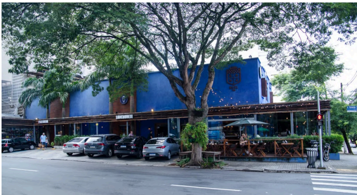
Fachada da Real Pizzaria & Lanchonete .