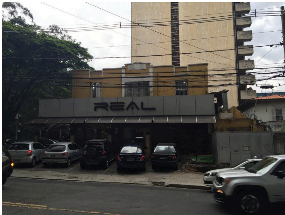
Fachada da Lanchonete & Pizzaria Real anterior à reforma. Disponível em: < http://leamezher.com.br/real-pizzaria/ >. Acesso em: janeiro de 2025.