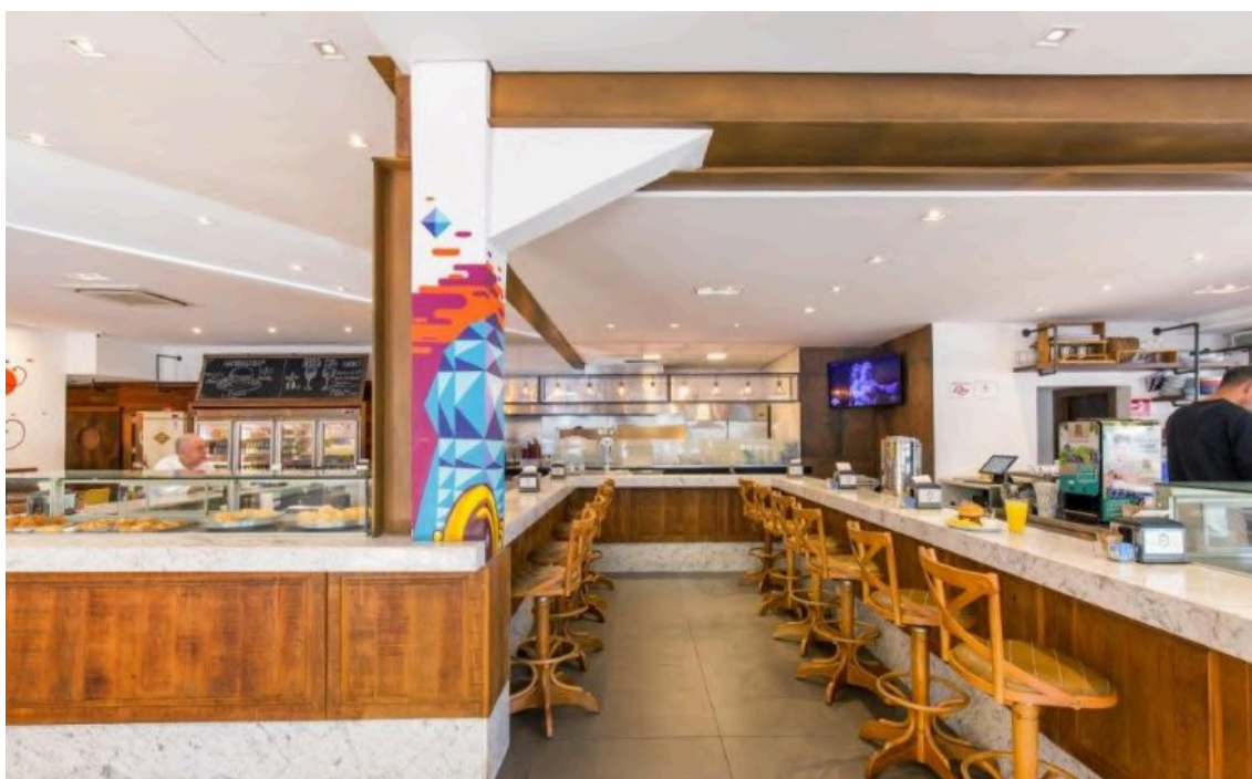
Área interna da lanchonete após a reforma. Disponível em: < http://leamezher.com.br/real-pizzaria/ >. Acesso em: janeiro de 2025.