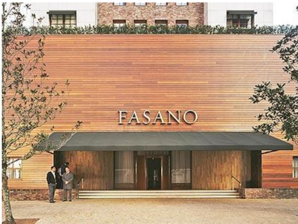
Fachada do Restaurante Fasano . Disponível em: < http://www.desicatur.com/fasano-sao-paulo/ >. Acesso em: agosto de 2016.