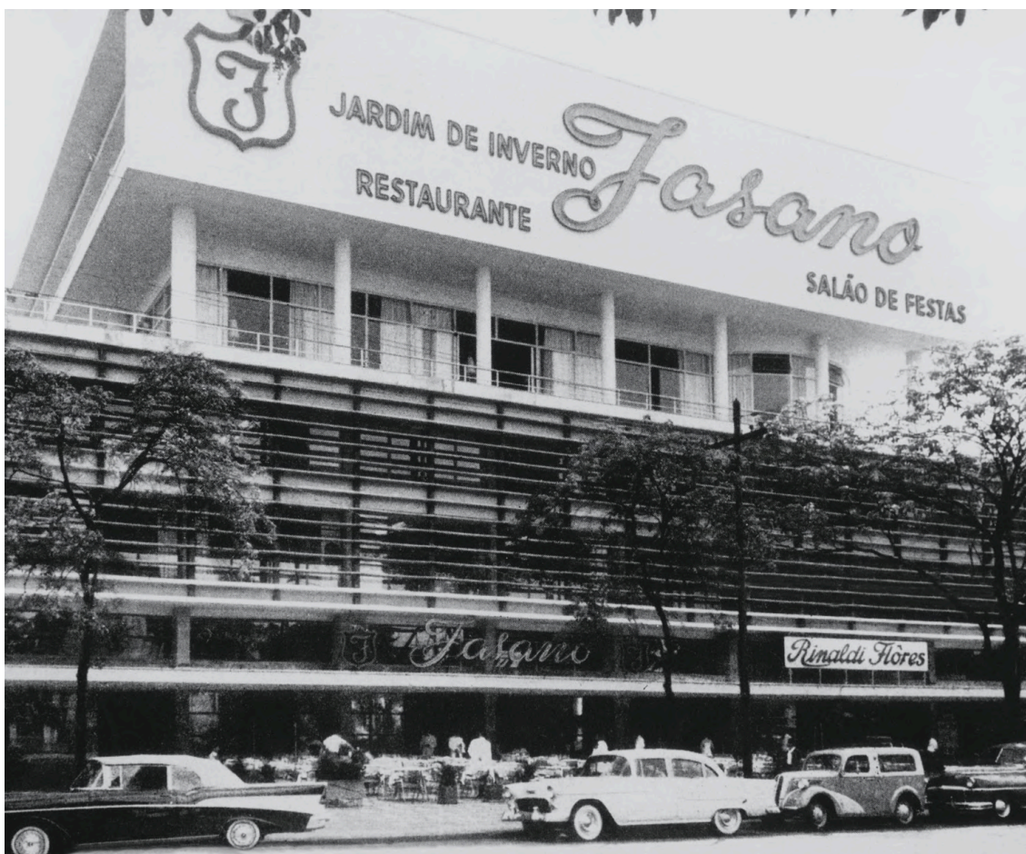
Restaurante Fasano no Conjunto Nacional.