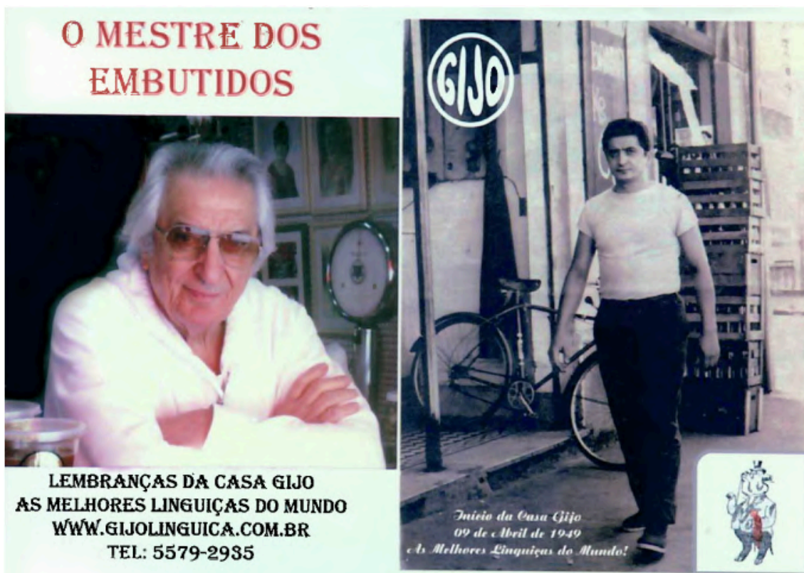
Material comemorativo fornecido pela Casa Gijo.