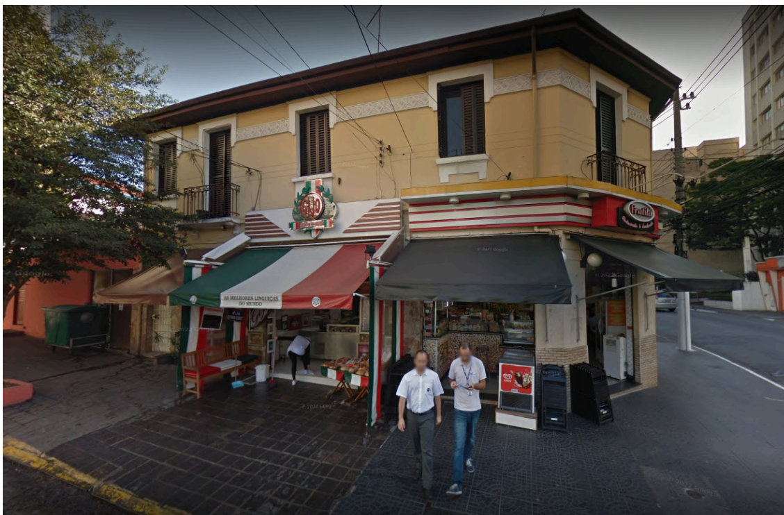
Casa Gijo, ao lado de uma lanchonete na esquina das ruas Doutor Pinto Ferraz e Vergueiro, na Vila Mariana.