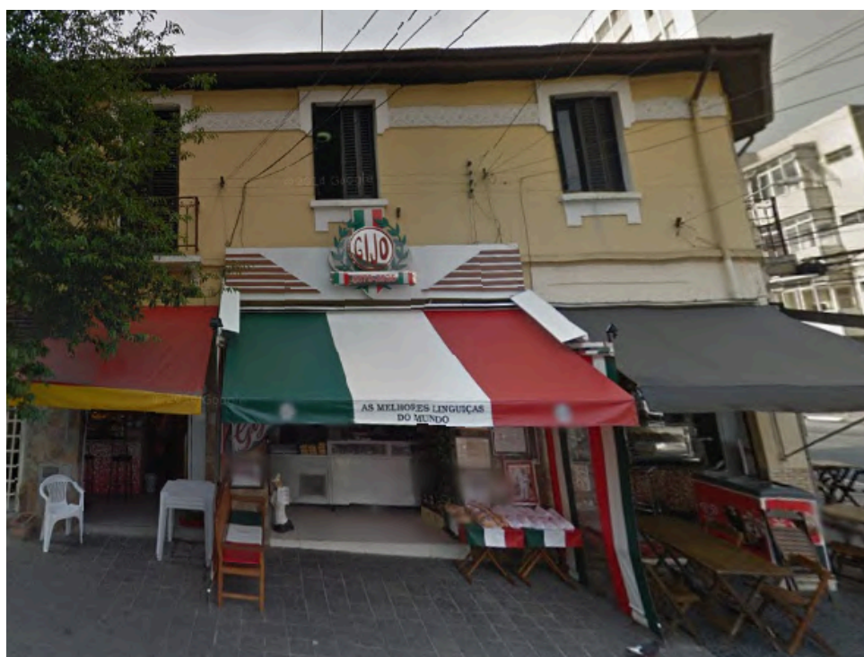
Fachada do Gijo Linguça . Imagem capturada pelo Google Street View em outubro de 2014. Acesso em: setembro de 2016.