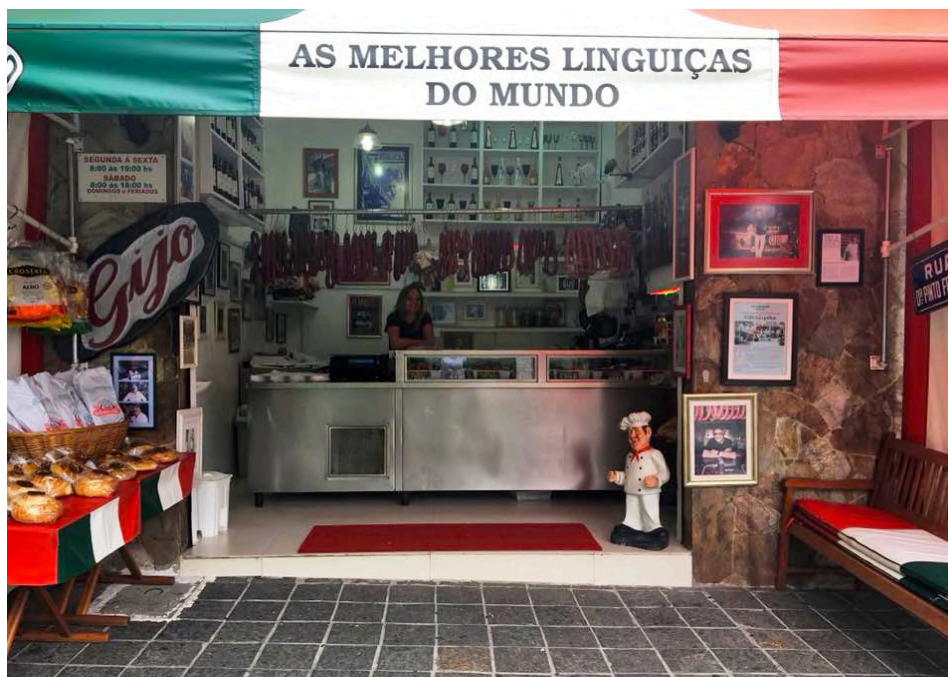
Fachada do Gijo Linguiça.

O ambiente é aconchegante e compacto, com um balcão frigorífico metálico que ocupa o centro do espaço. Acima dele, há linguiças penduradas, compondo uma típica cena de açougues. A decoração é marcada por fotografias e diversos elementos que homenageiam a cultura italiana. Também há quadros com matérias publicadas na imprensa e fotos de Gijo, criando uma atmosfera nostálgica e convidativa.