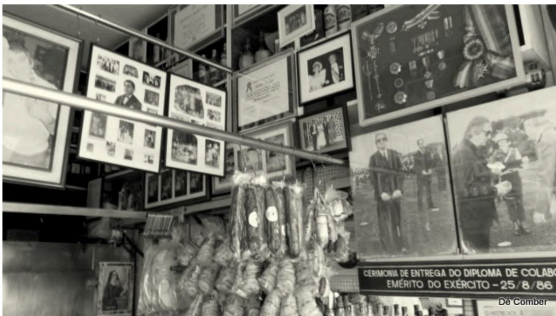
Decoração do Gijo Linguiça. COMBER, André. Casa Gijo Linguicaria e suas maravilhosas linguíças artesanais. DIÁRIOS GASTRONÔMICOS, 12 de out. de 2011. Disponível em: https://diariosgastronomicos.com.br/casa-gijo-linguicaria/ . Acesso em: 29 de janeiro de 2025.