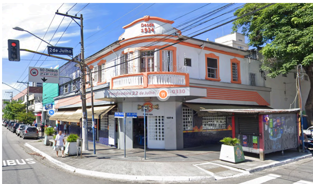
Fachada da Padaria 22 de Julho . Fonte: Google Street View, jan. de 2019. Acesso em: 30 de jan. de 2025.