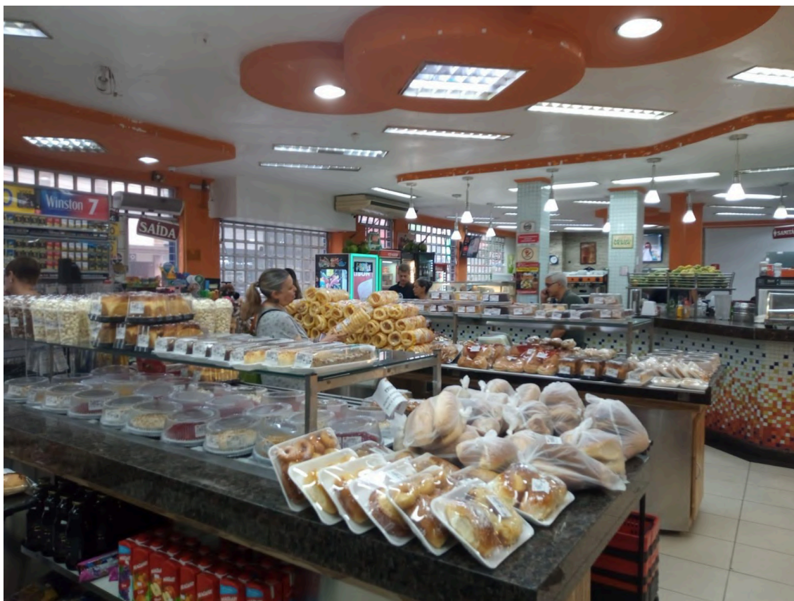
Interior da Padaria 22 de Julho. 29/01/2025.