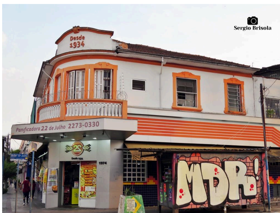
Fachada da Padaria 22 de Julho. Sergio Brisola. 19/03/2022. Disponível em: Edificação antiga da Panificadora 22 de Julho - Descubra Sampa - Cidade de São Paulo. Acesso em: janeiro de 2025.