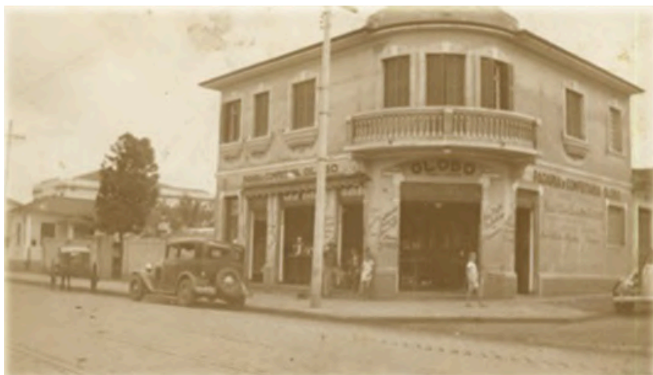
Fachada da Padaria 22 de Julho. Autor desconhecido. Sem data. Disponível em: http://www.padaria22dejulho.com.br/ . Acesso em: setembro de 2016.