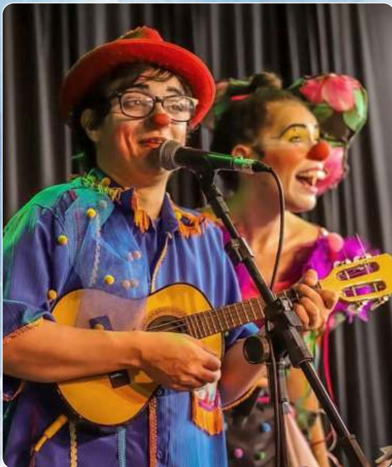
Bloco dos Palhaços Batutas