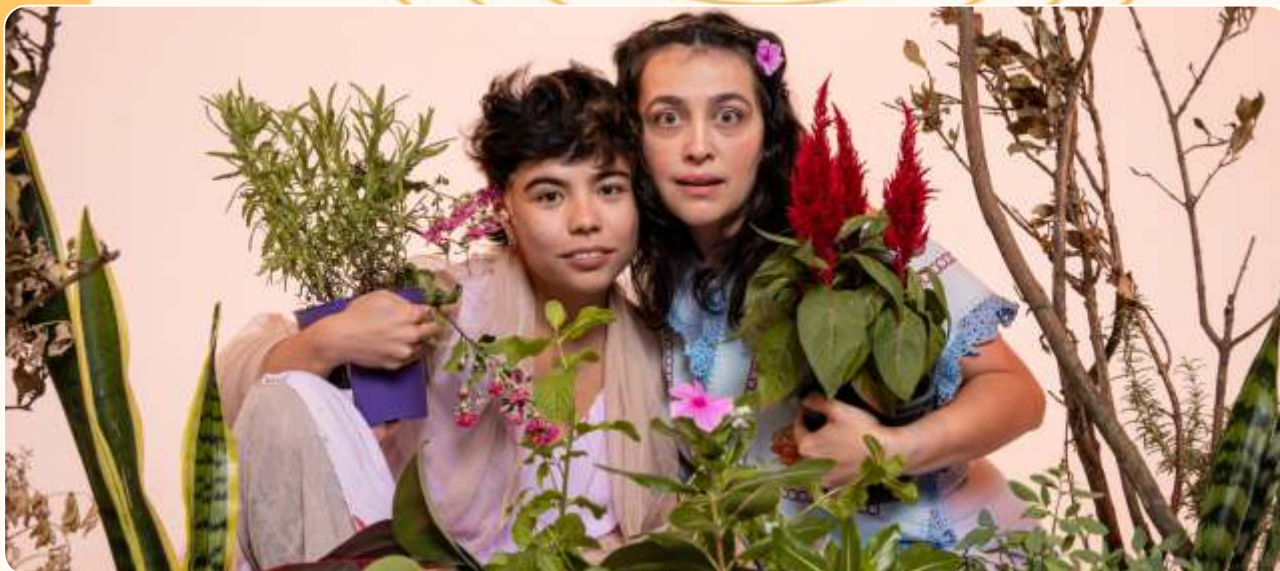
Histórias da Mata Calada