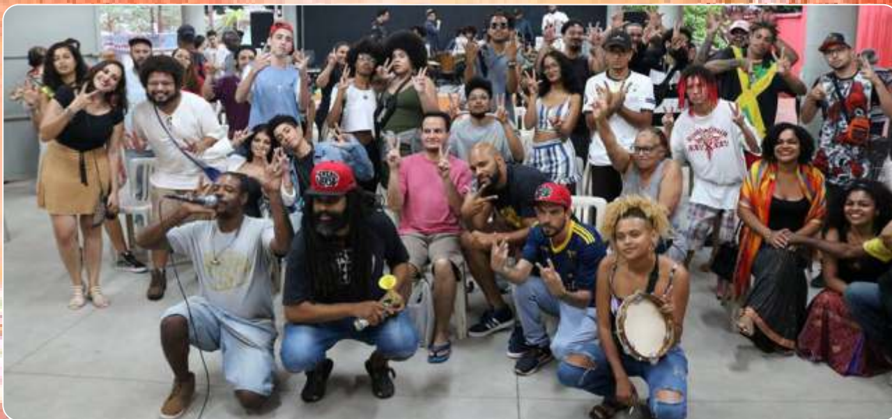
Sarau Verso em Versos