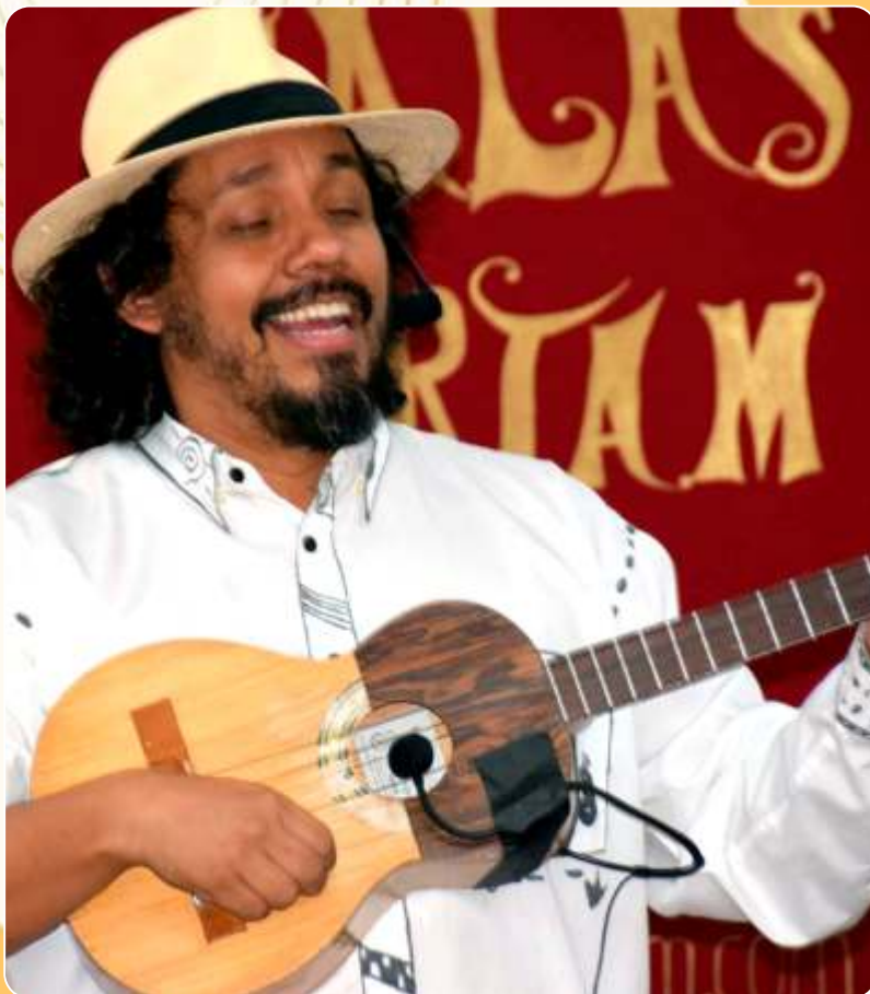
Histórias em Cordel: do Livro e da Memória