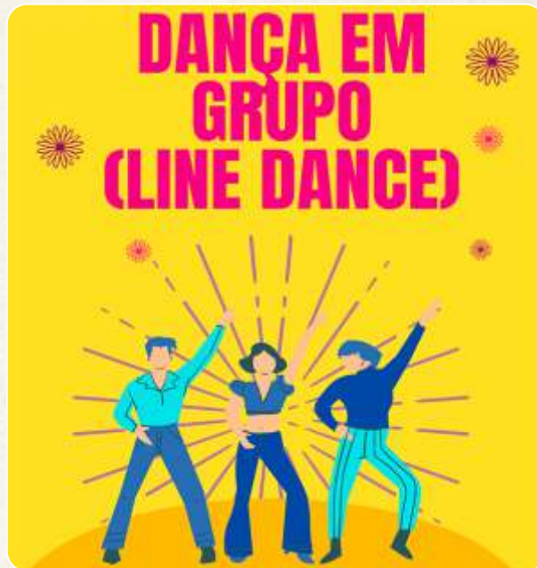
Dança em Grupo

Segundas-feiras às 15h e terças-feiras às 14h - Biblioteca Lenyra Fraccaroli