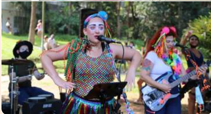
Brincando de carnaval