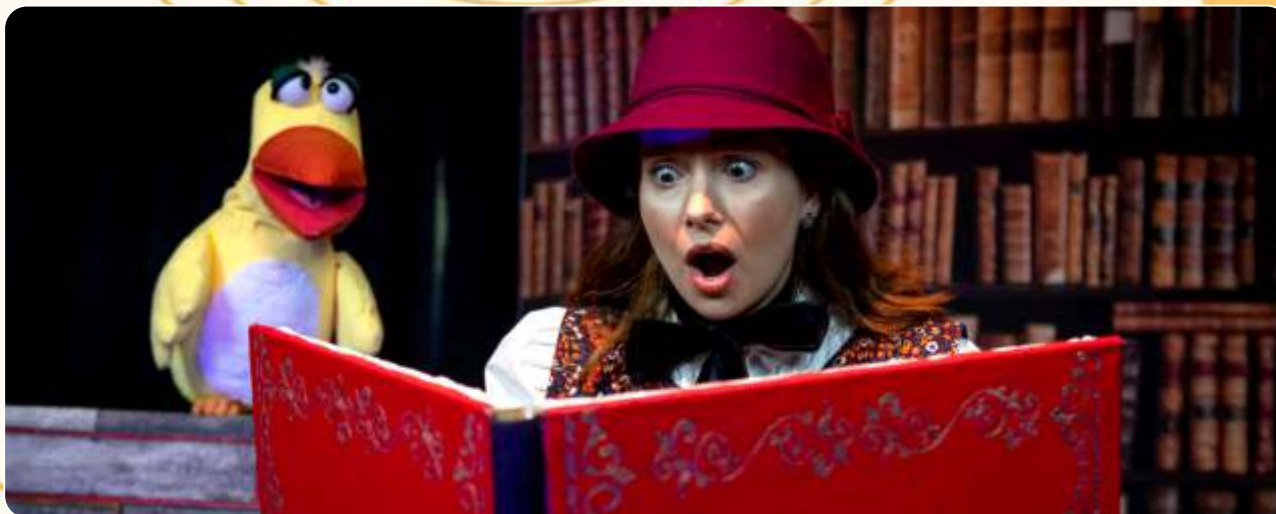
Você tem medo?