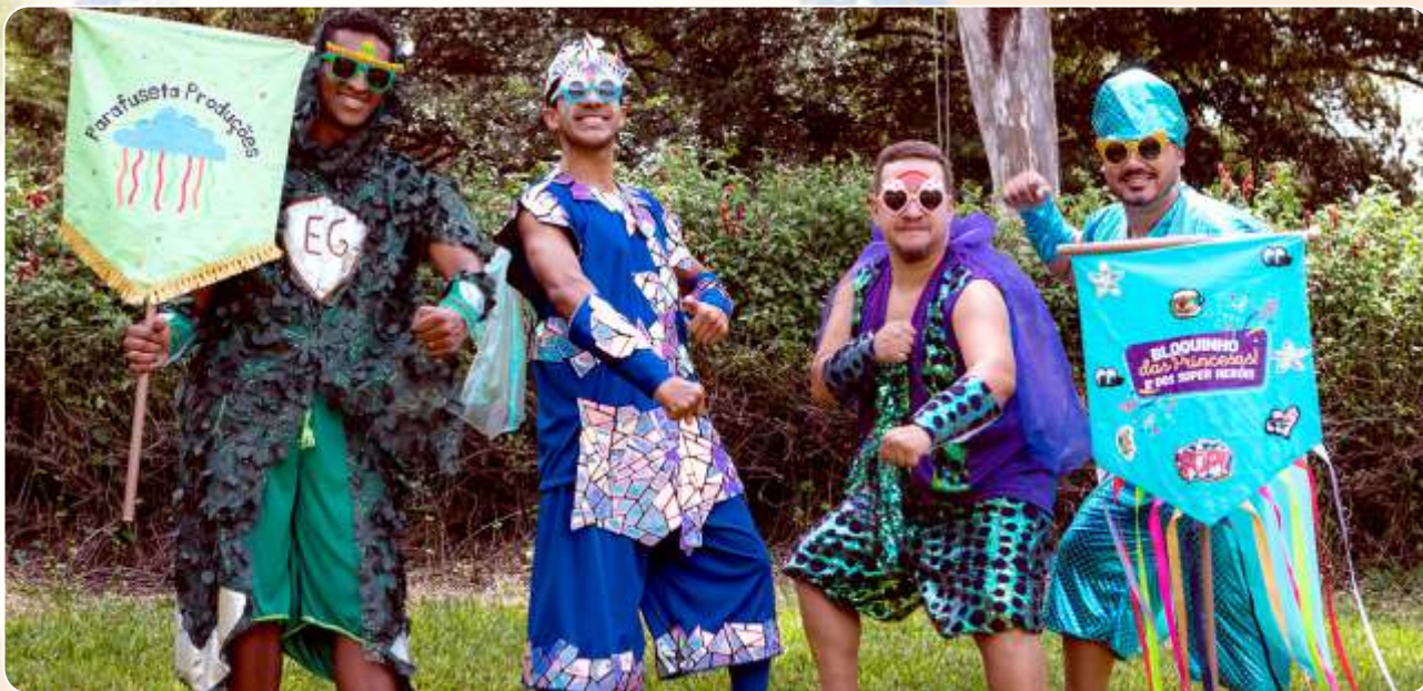
Bloquinho das Princesas e dos Super-Heróis