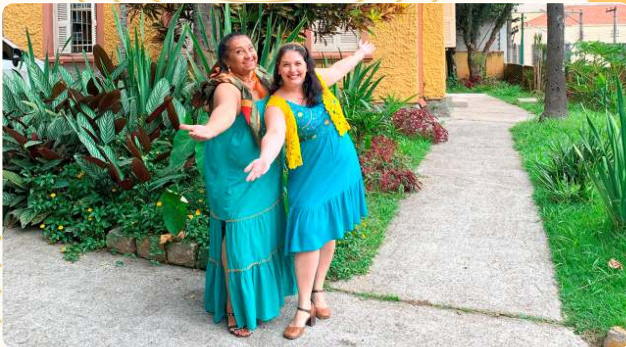
4 Contos de Mulheres dos 4 Cantos do Mundo