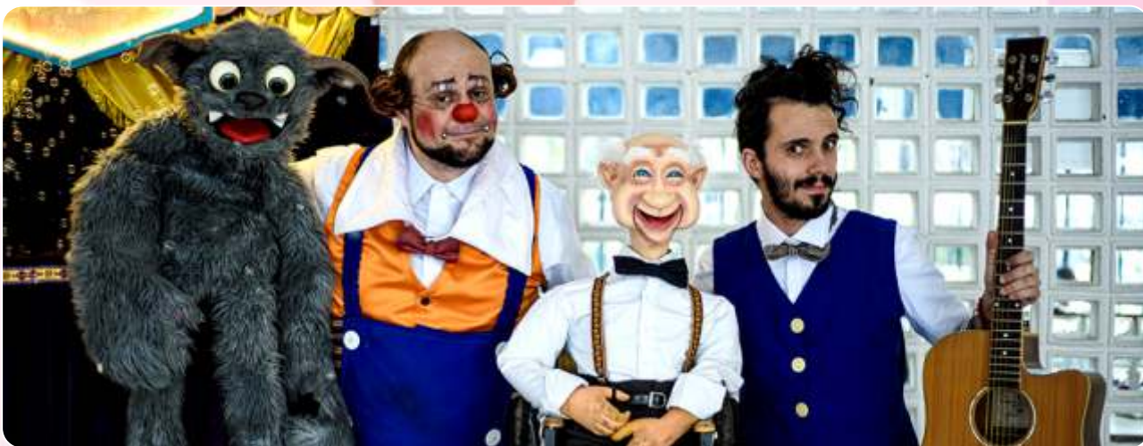
Palhaço não dá Medo