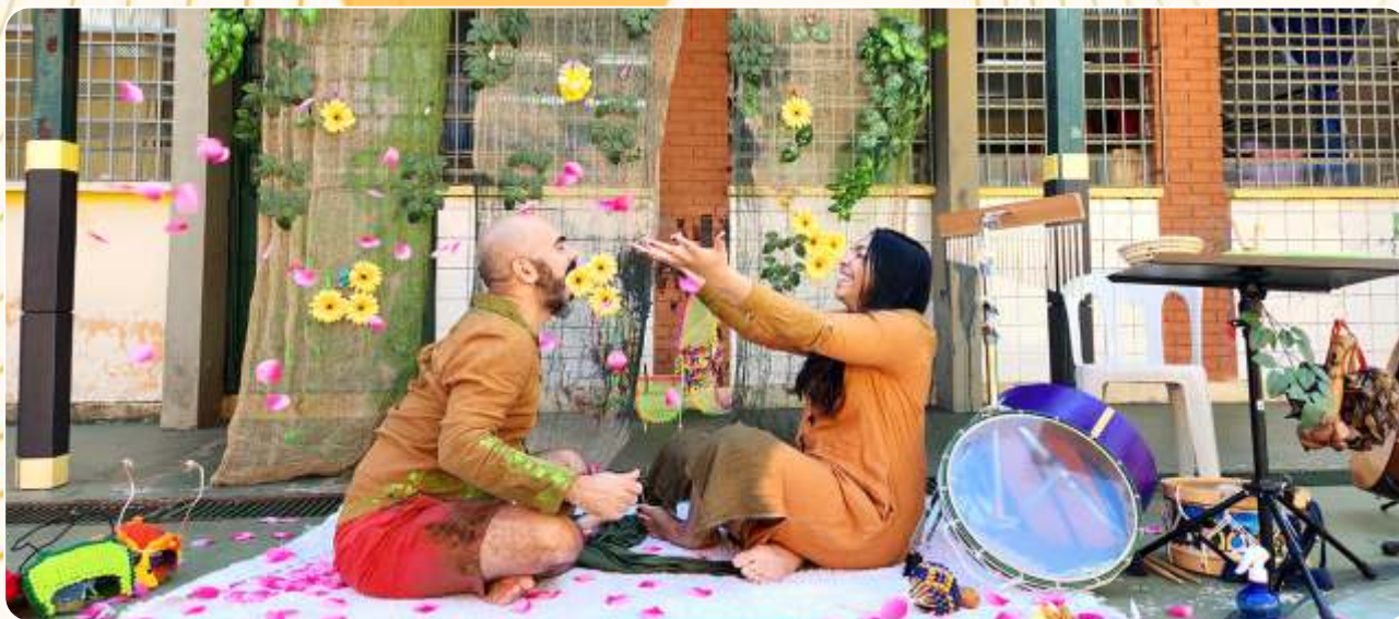
O Jardim dos Bebês