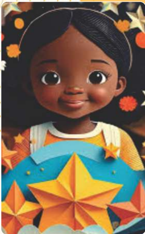
Júlia e a Noite das Estrelas Mágicas