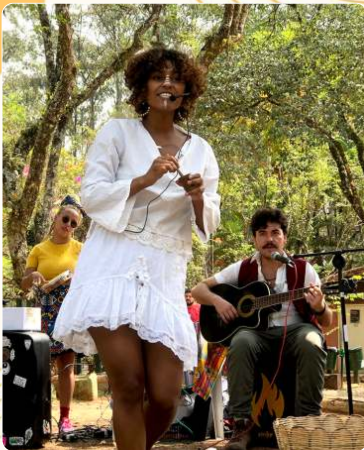
AB(AYÔ)MI | Contos Ancestrais