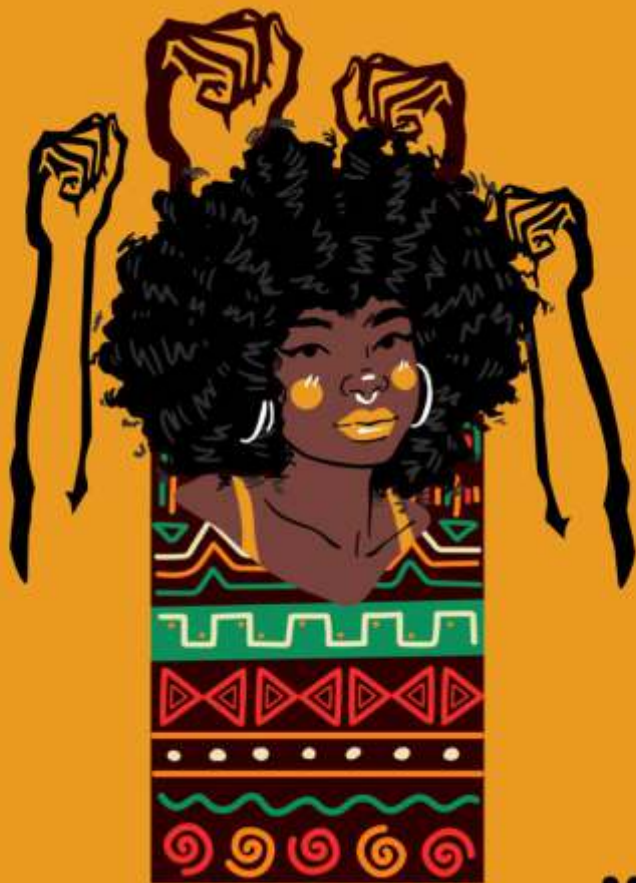
Mulheres Negras no Hip Hop e no Protagonismo Periférico