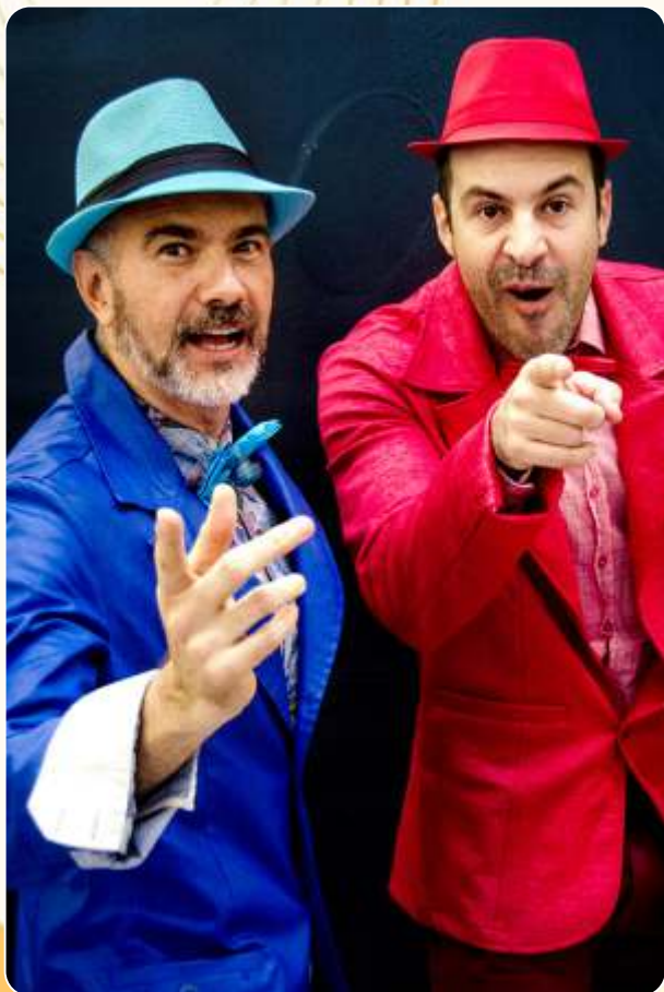
Pânico na Biblioteca