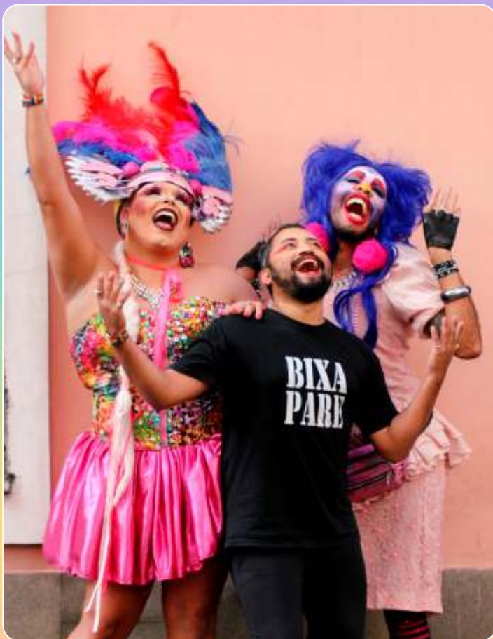
Sarau Bixaria Literária