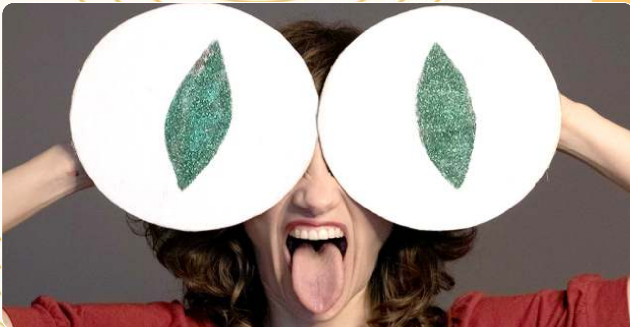
Cia. Pé do Ouvido