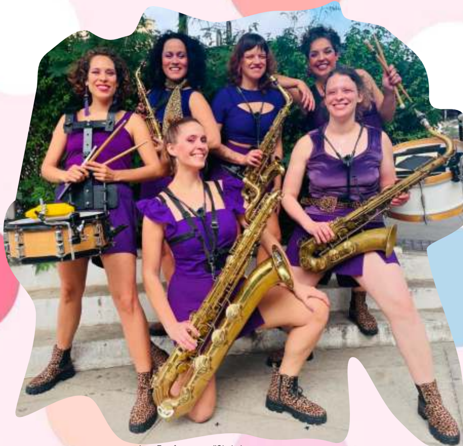
Las Fanfarronas "Si si si»