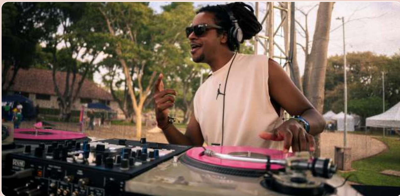
Brota e Convoca - Mulungu