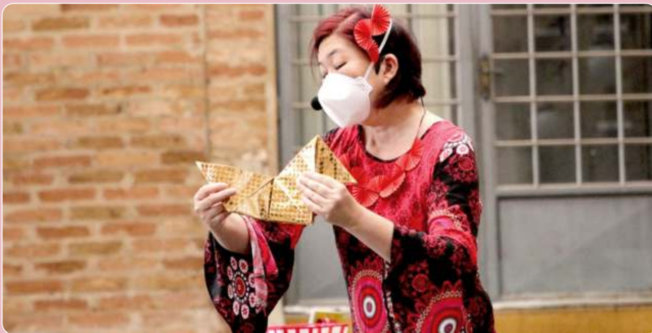
Histórias Brincantes com Origamis