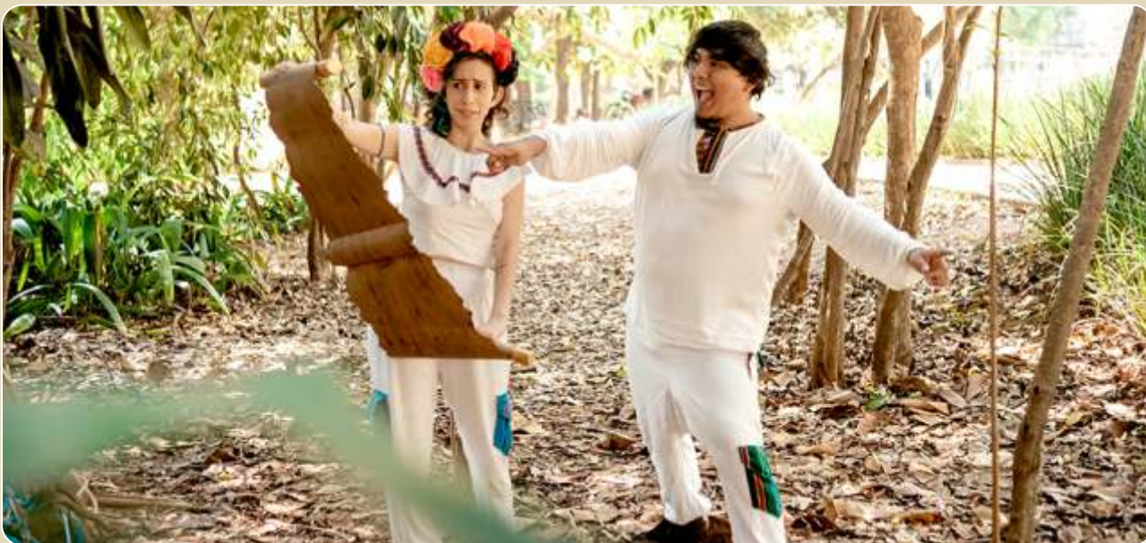
Recontação de Memórias Latinas