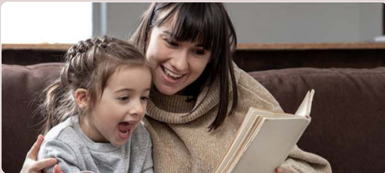
Tempo de Brincar, Tempo de Cuidar