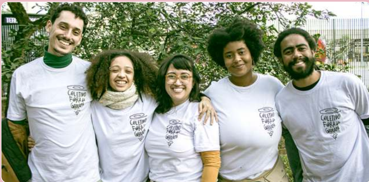
Redemoinhos de Sacys: Histórias, Milhos e Amuletos