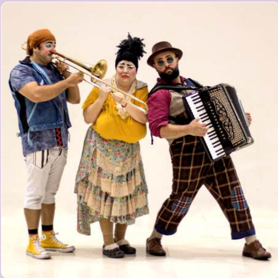
Vende-se Um Trombone