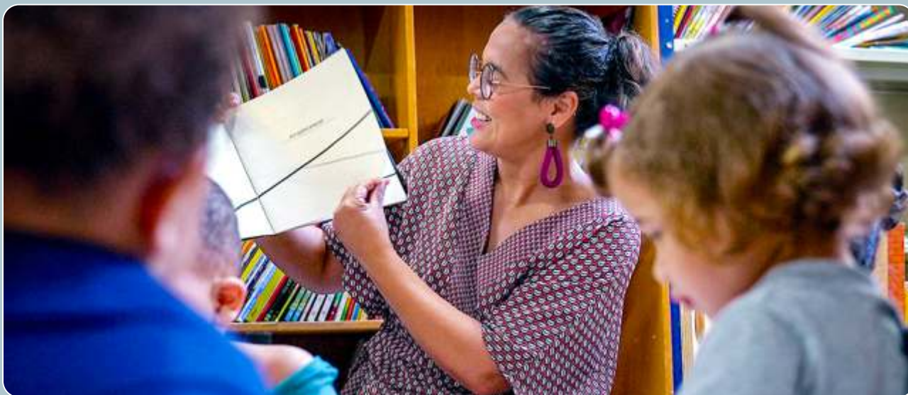
Lendo com Bebês