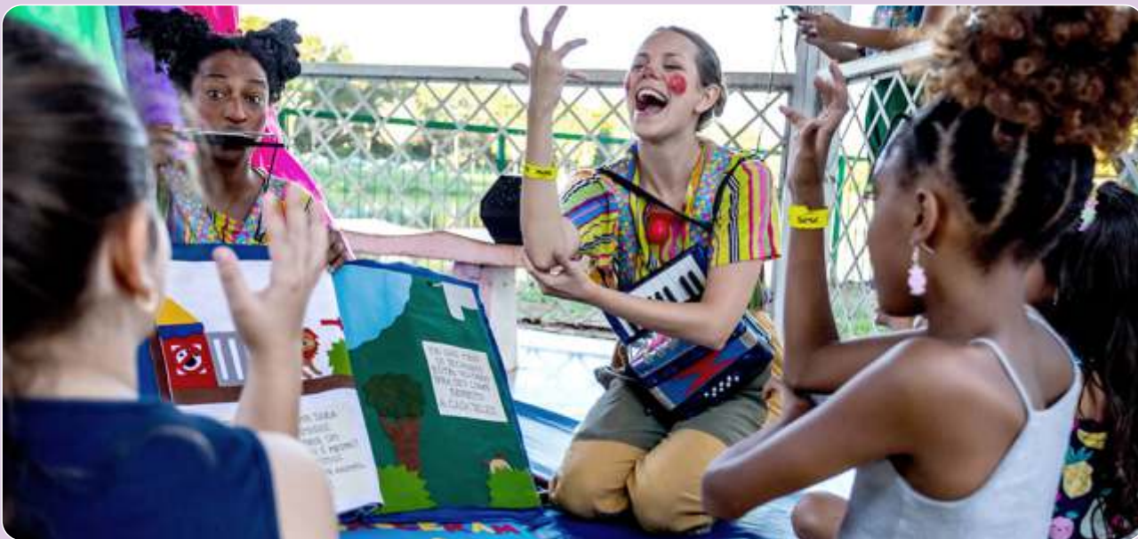
Brincando de Contar no Circo da Lua