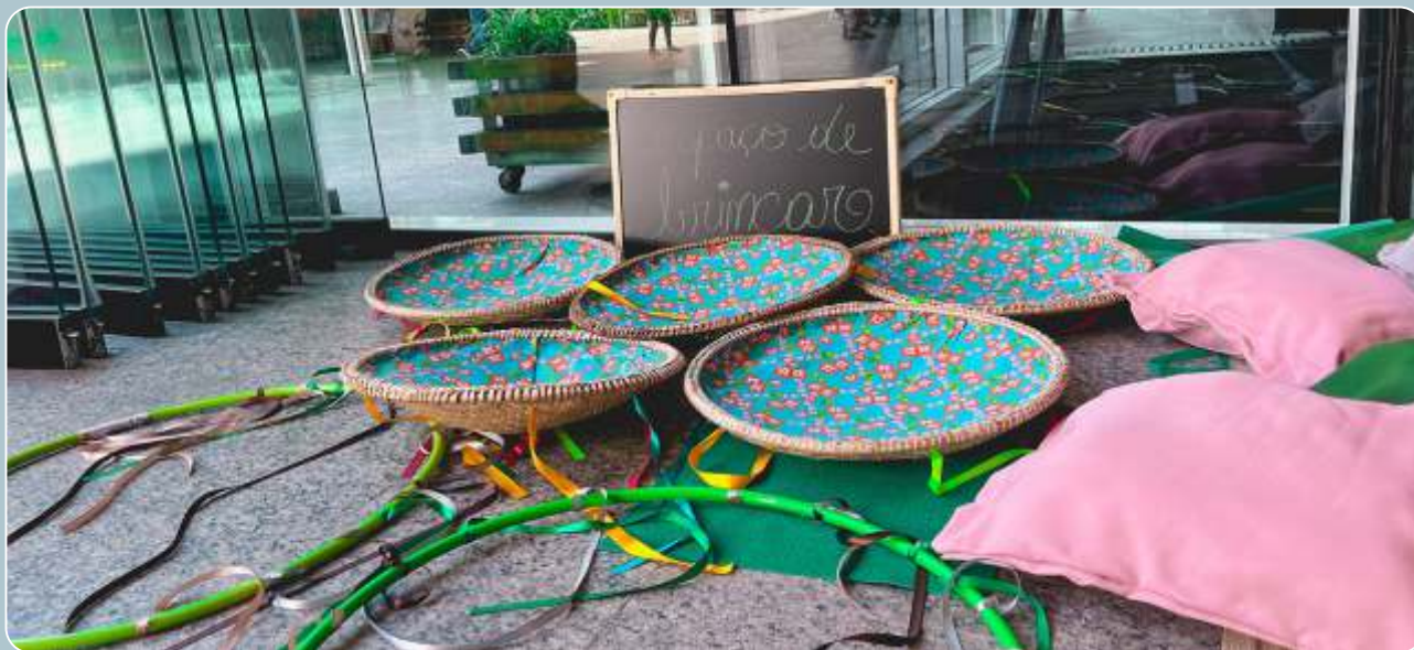
Histórias do Nosso Jardim