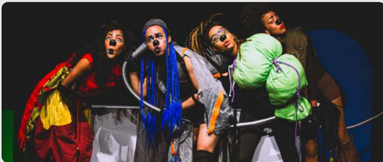
As Meninas Super Empoderadas