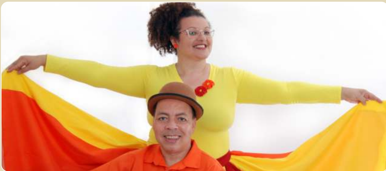
O Festejo de Chico