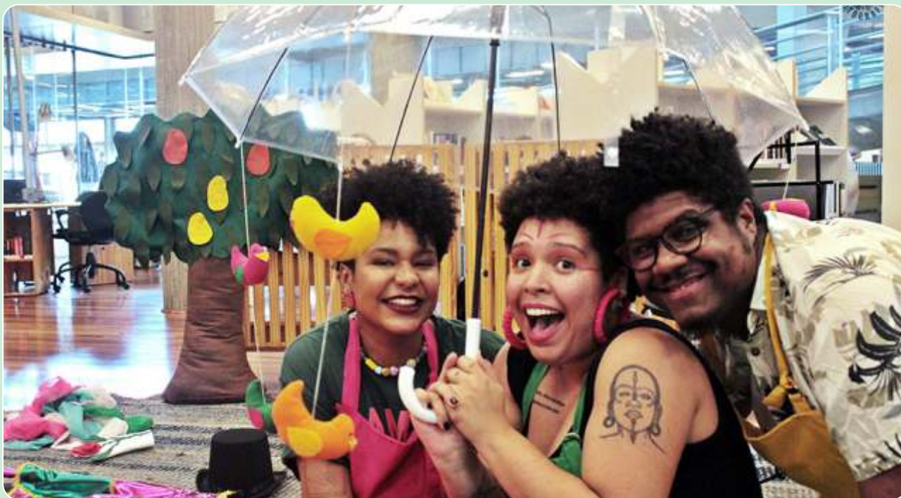
O Sol Nascerá