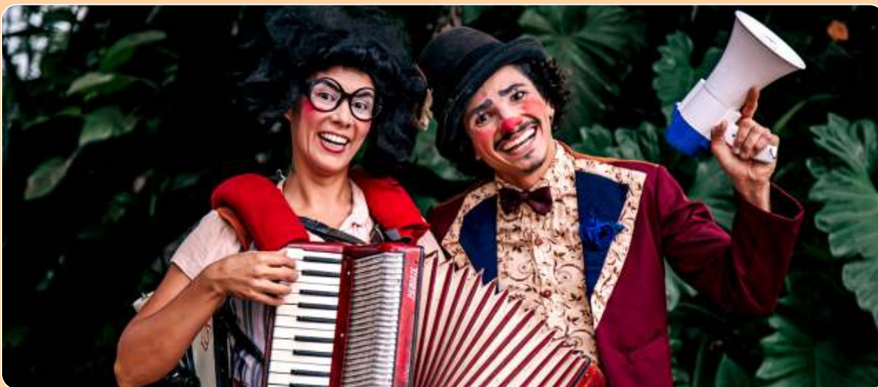
Suspiros e Burbujas