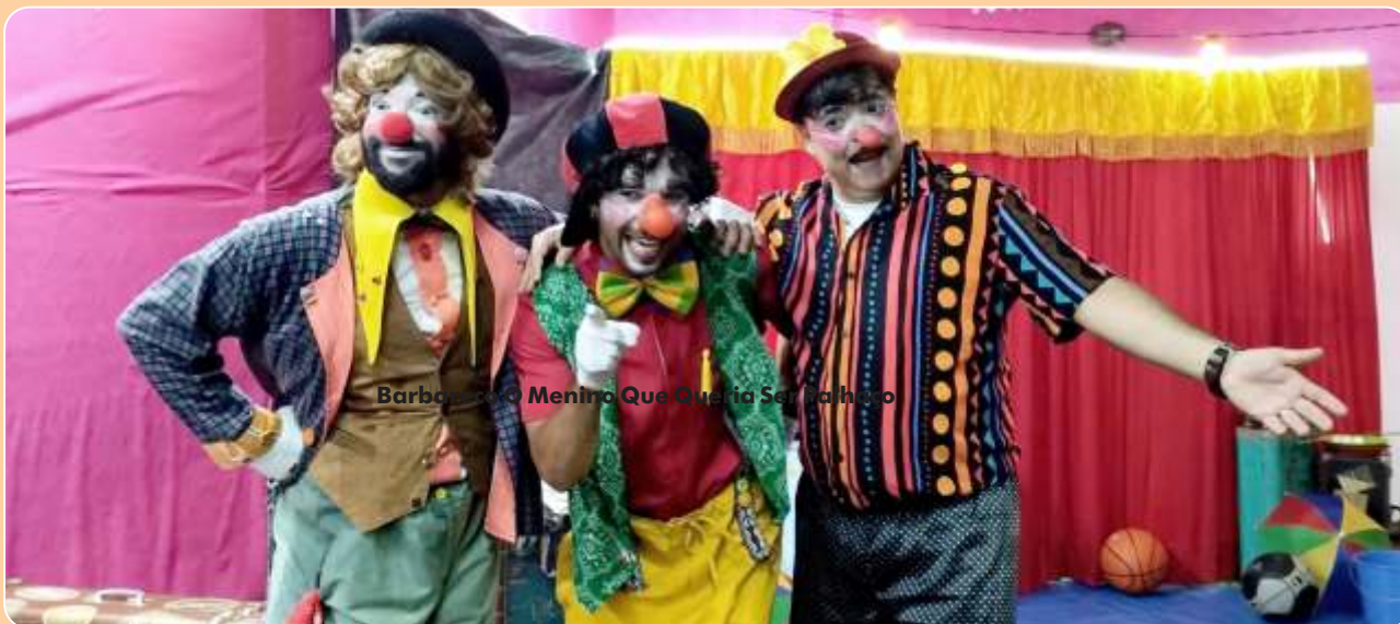
Barbareco O Menino Que Queria Ser Palhaço