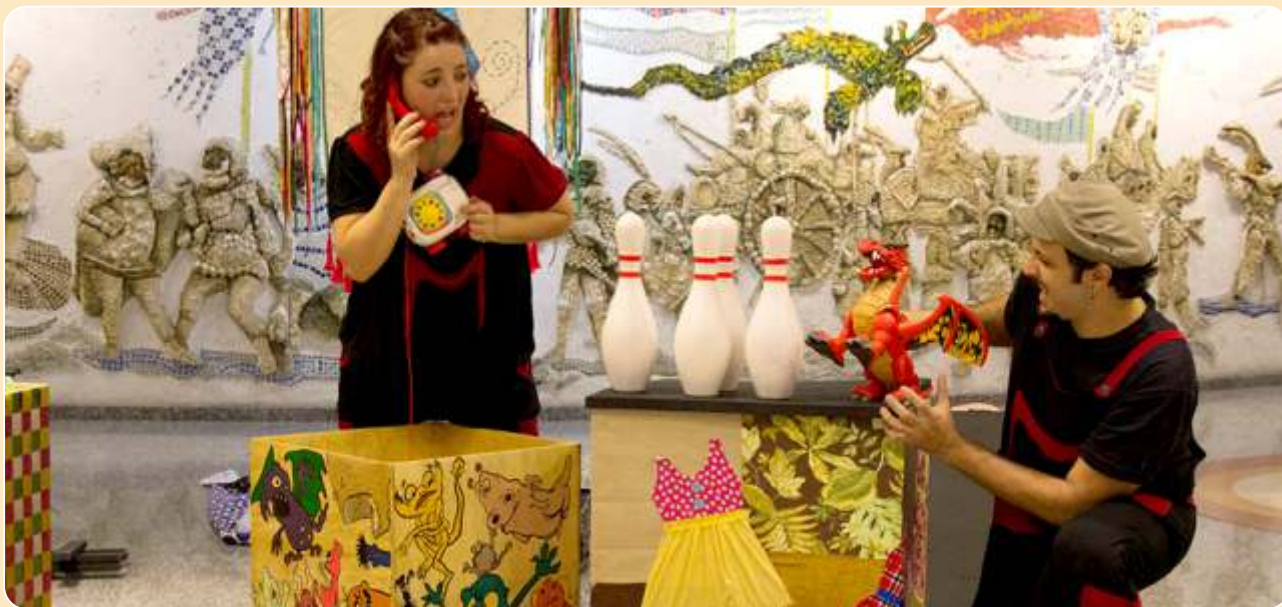
Conto de Brinquedo