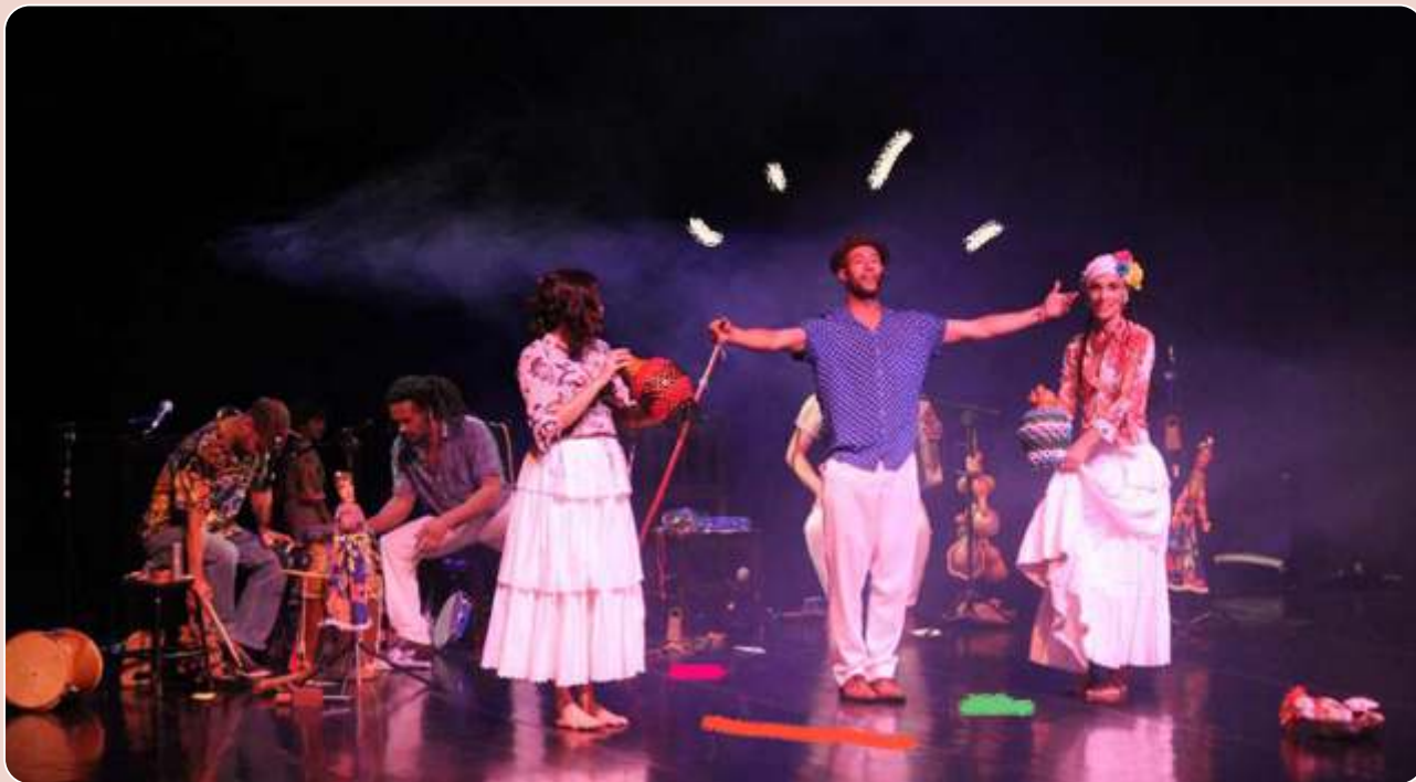
Poesia de Repente para Crianças