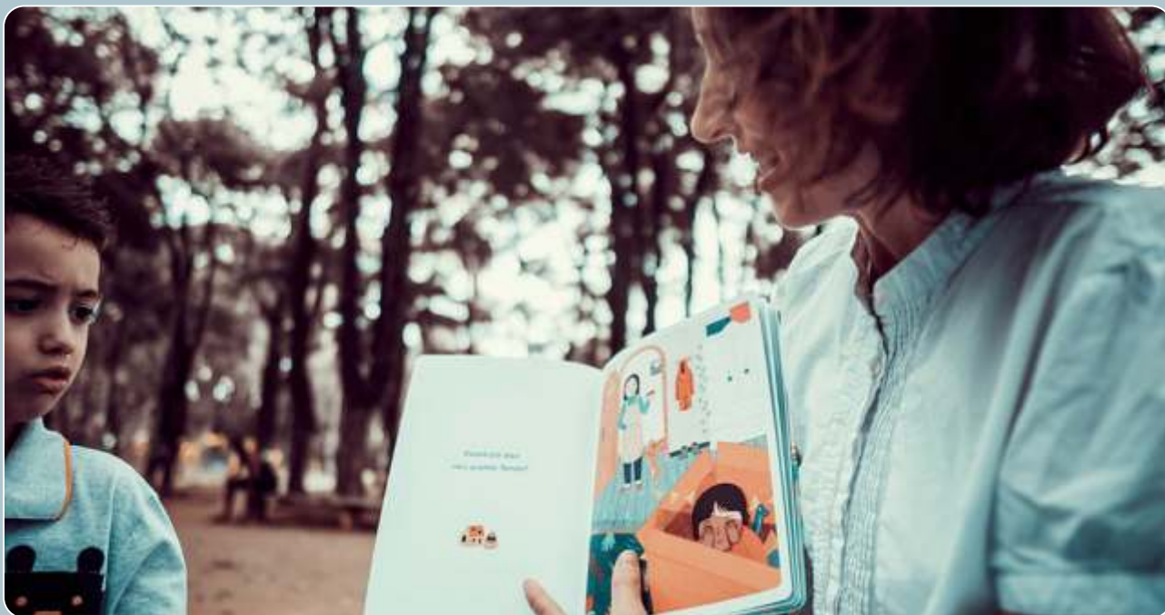
Histórias para Navegar