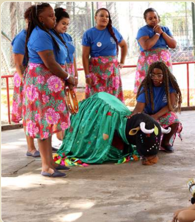
Cortejo do Boi Folhinha