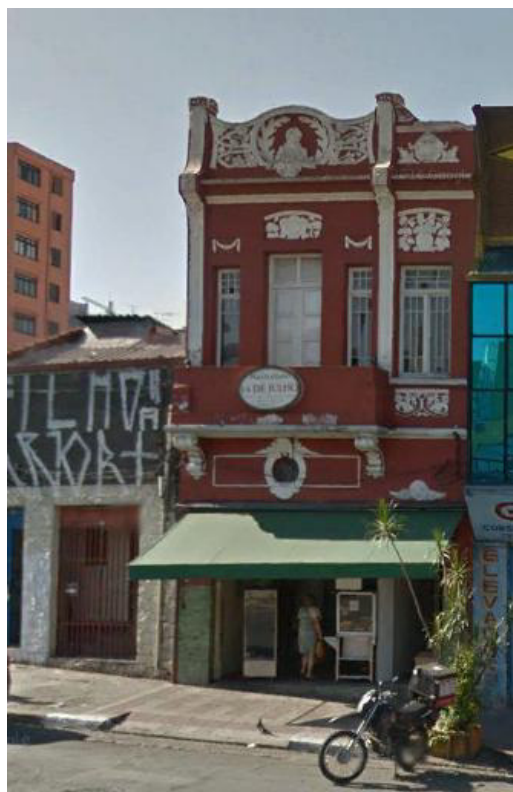
Fachada da Padaria 14 de julho .