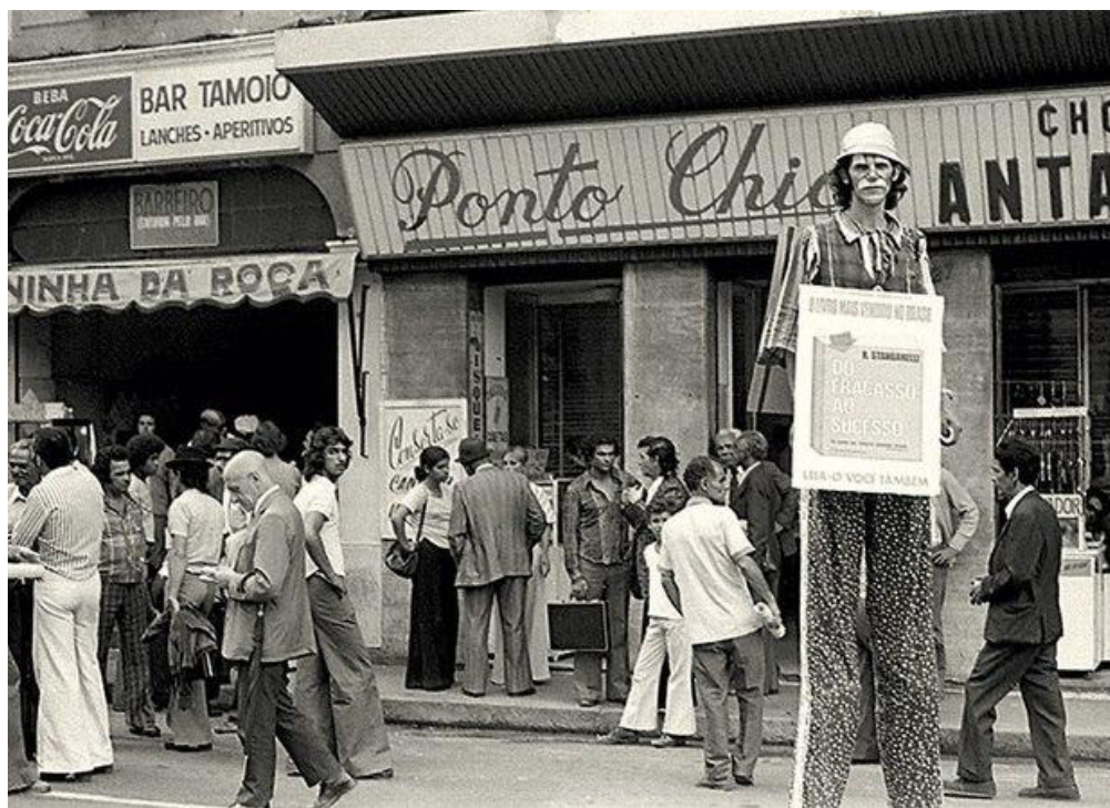
Artistas circenses se reúnem no Largo do Paissandu, em evento conhecido como “café dos artistas”. Observar a fachada o Ponto Chic. Foto: provavelmente, nos anos 1970. Autor desconhecido. Disponível em: http://www.pontochic.com.br/ponto-chic-restaurante/lojas/restaurante-paissandu/3 Acesso em outubro de 2016.