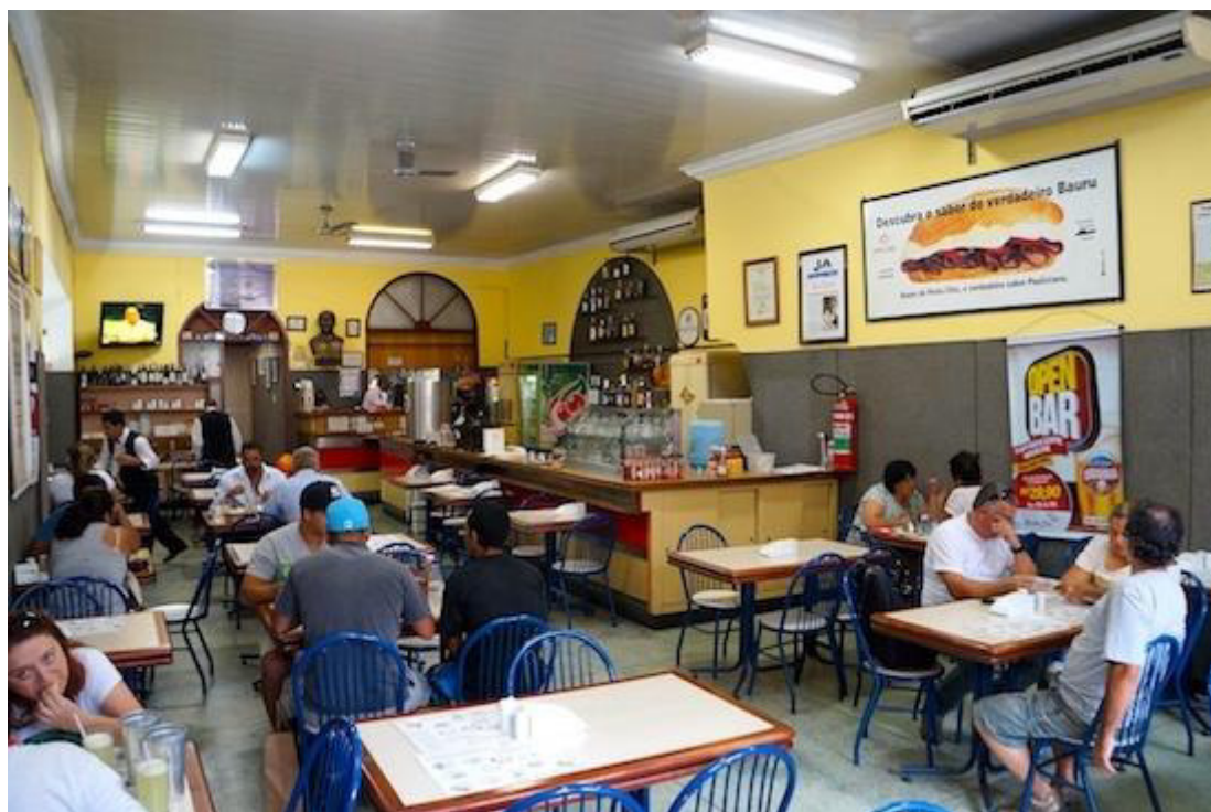
Aspecto geral do interior do Ponto Chic . Autor desconhecido. Disponível em: http://www.pontochic.com.br/ponto-chic-restaurant/lojas/restaurant-paissandu/3 Acesso em agosto de 2016.