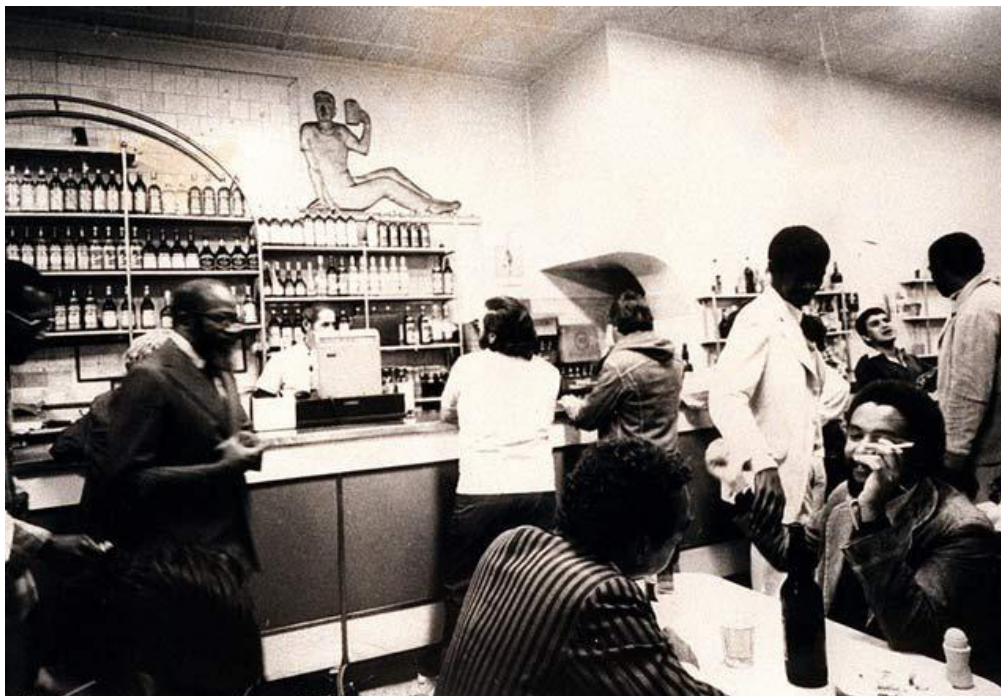
Interior do restaurante, provavelmente, nos anos 1970. Autor desconhecido. Disponível em: http://www.pontochic.com.br/ponto-chic-restaurante/lojas/restaurante-paissandu/3 . Acesso em outubro de 2016.