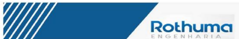
Figura 1 - AVALIAÇÃO IMOBILIÁRIA