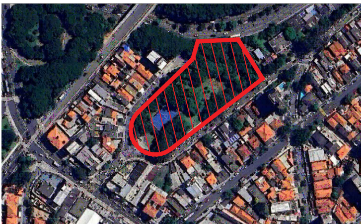
CROQUI DE LOCALIZAÇÃO SEM ESCALA