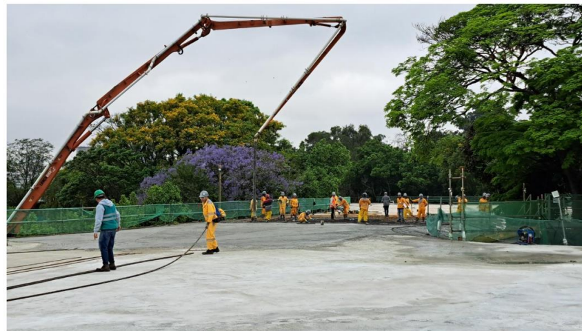
Concretagem bloco 13 – outubro/2024