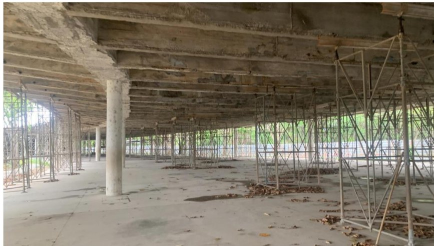
Cimbramento e Forro demolido – outubro/2024

Valor R$ 71.977.260,98 | Solicitado FUNDURB: R$ 35.700.000,00