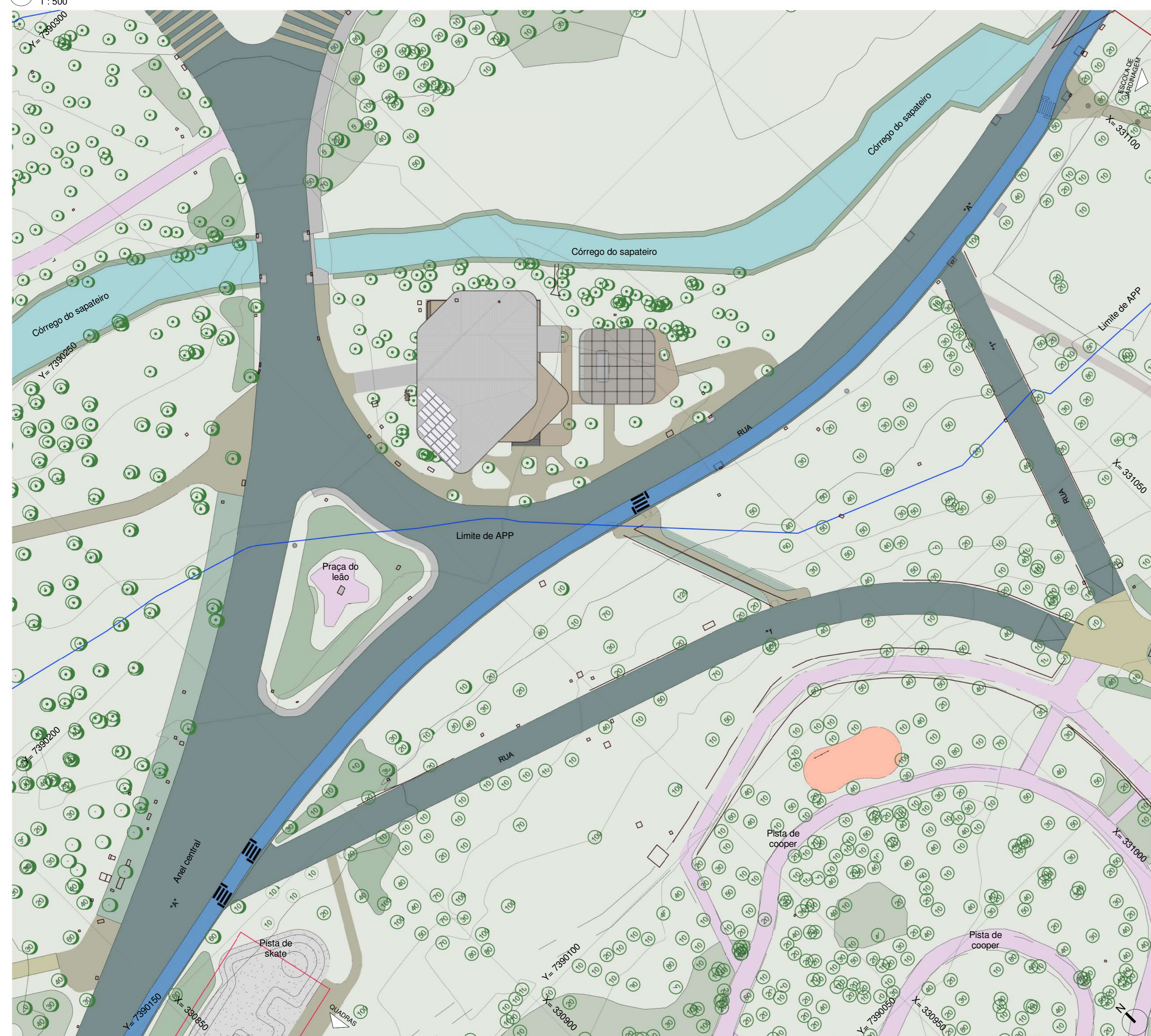
2 Planta geral de implantação da proposta