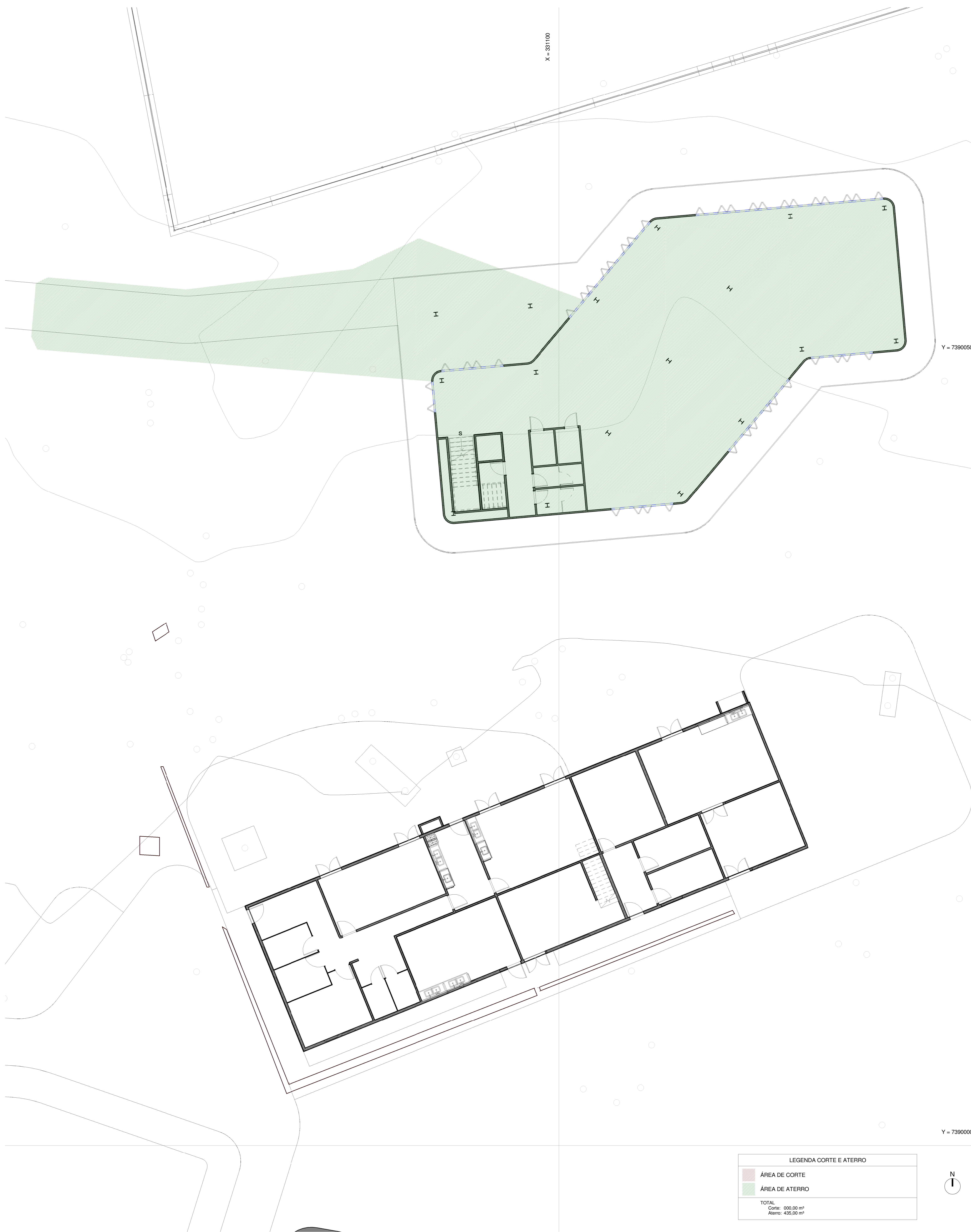
3 Planta de corte/aterro 1:100