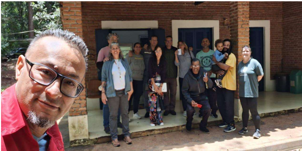
autoria: Joaniro, 2024.