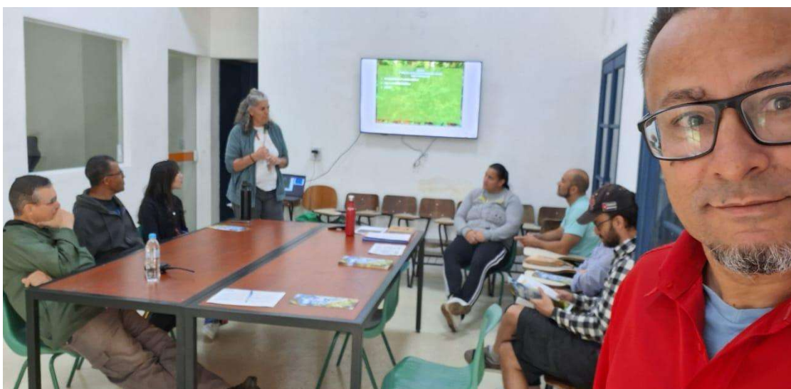
autoria: Joaniro, 2024.