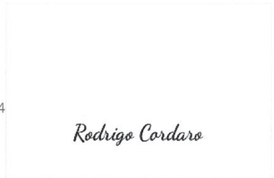
Assinatura de Rodrigo Cordaro

Pontos de autenticação: Assinatura na tela Código enviado por e-mail IP: 191.204.178.185 / Geolocalização: -23.559076, -46.569754 Dispositivo: Mozilla/5.0 (Windows NT 10.0; Win64; x64) AppleWebKit/537.36 (KHTML, like Gecko) Chrome/125.0.0.0 Safari/537.36 Data e hora: Junho 04, 2024, 16:43:16 E-mail: comercial@construtoralettieri.com.br (autenticado com código único enviado exclusivamente a este e-mail) Telefone: + 5511971309558 ZapSign Token: bc1adf87-****-****-****-2a048a04524c