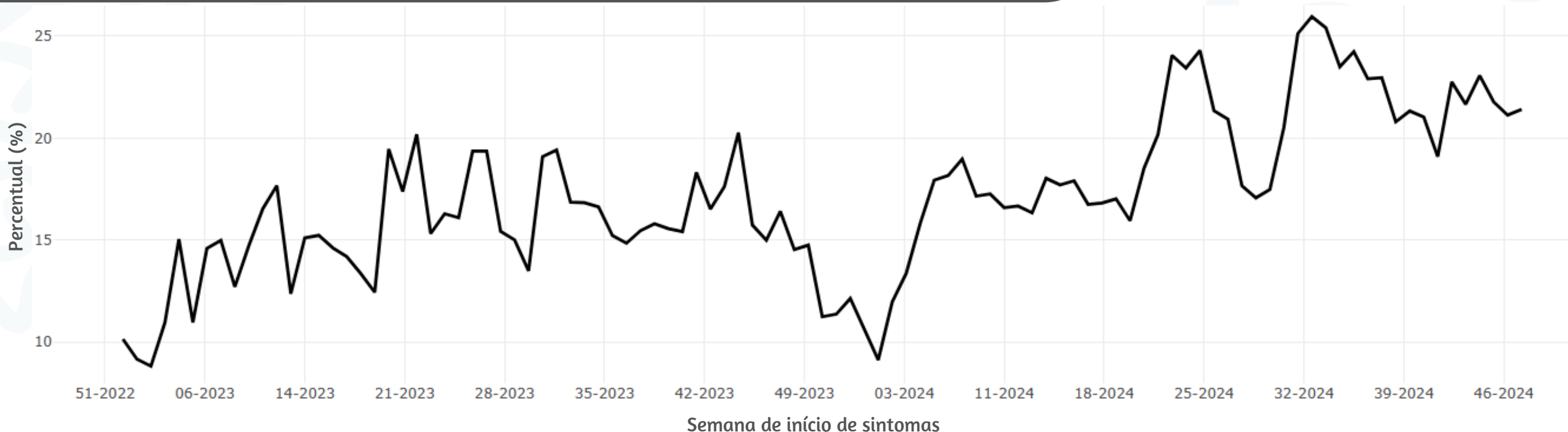
Figura 3. Percentual de atendimentos por Síndrome Gripal(%) em Unidade Sentinela segundo semana epidemiológica de início de sintomas, MSP, 2023 a 2024

Dados extraídos em 11/12/2024.