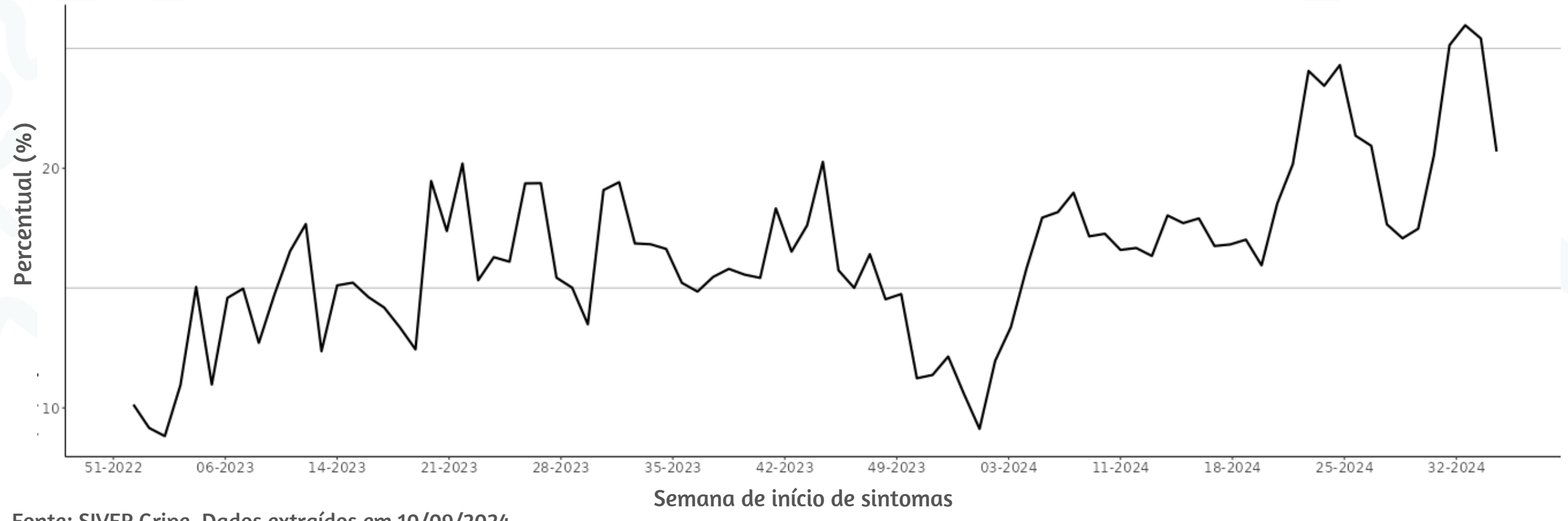
Figura 3. Percentual de atendimentos por Síndrome Gripal(%) em Unidade Sentinela segundo semana epidemiológica de início de sintomas, MSP, 2023 a 2024