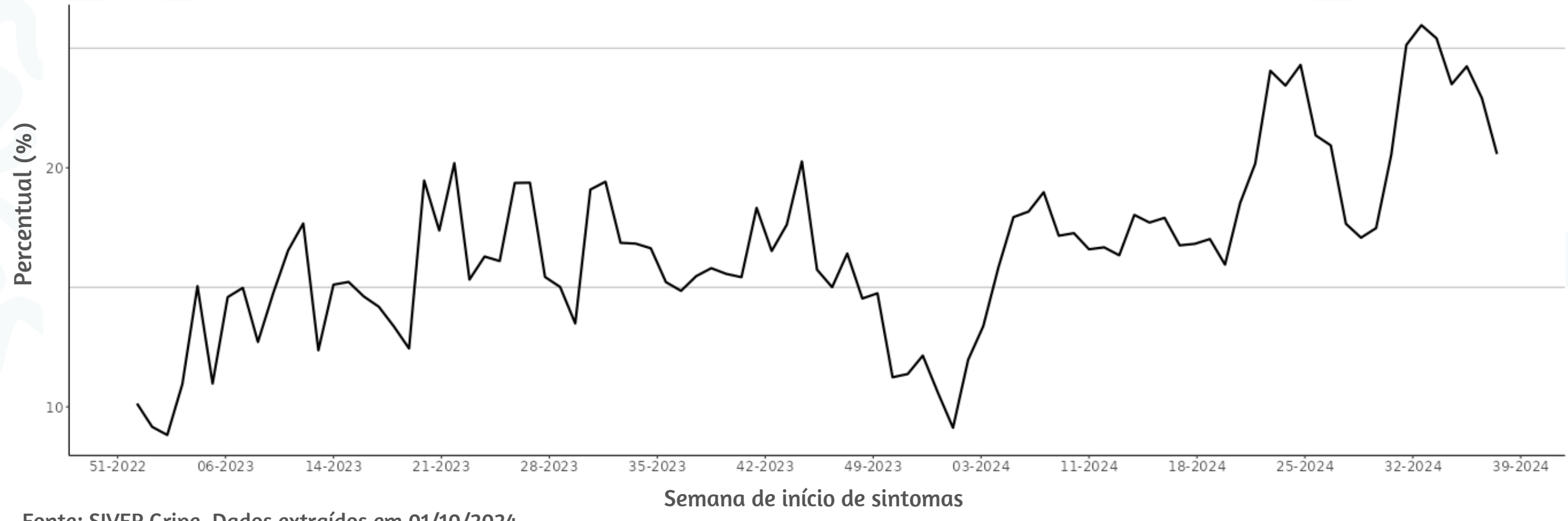
Figura 3. Percentual de atendimentos por Síndrome Gripal(%) em Unidade Sentinela segundo semana epidemiológica de início de sintomas, MSP, 2023 a 2024