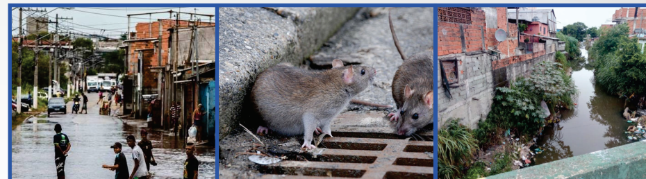
Imagem 1: Chuvas afetam vida dos moradores da Vila Itaim, zona leste de São Paulo Edu Garcia/R7 https://noticias.r7.com/sao-paulo/buracos-e-carros-submersos-zona-leste-de-sp-sofre-com-enchentes-13022019 Imagem 2: ht https://spdiario.com.br/moradores-sofrem-com-infestacao-de-ratos-na-zona-sul-de-sp/ Imagem 3: https://www.prefeitura.sp.gov.br/cidade/secretarias/subprefeituras/jacana_tremembe/noticias/?p=90369

A doença acomete principalmente populações residentes em áreas de risco nas quais há fatores determinantes para manutenção desta realidade, como ocupação de fundos de vale, proximidade a córregos, precariedade de saneamento básico e no padrão de habitabilidade, deficiências na coleta e destinação de resíduos sólidos, associados a fatores climáticos, como a ocorrência de inundações.