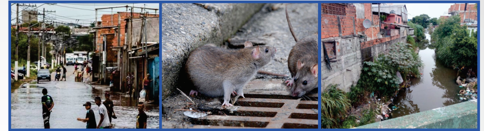
Imagem 1: Chuvas afetam vida dos moradores da Vila Itaim, zona leste de São Paulo Edu Garcia/R7 https://noticias.r7.com/sao-paulo/buracos-e-carros-submersos-zona-leste-de-sp-sofre-com-enchentes-13022019 Imagem 2: ht https://spdiario.com.br/moradores-sofrem-com-infestacao-de-ratos-na-zona-sul-de-sp/ Imagem 3: https://www.prefeitura.sp.gov.br/cidade/secretarias/subprefeituras/jacana_tremembe/noticias/?p=90369

A doença acomete principalmente populações residentes em áreas de risco nas quais há fatores determinantes para manutenção desta realidade, como ocupação de fundos de vale, proximidade a córregos, precariedade de saneamento básico e no padrão de habitabilidade, deficiências na coleta e destinação de resíduos sólidos, associados a fatores climáticos, como a ocorrência de inundações.