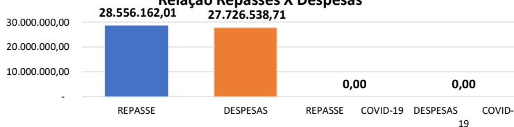
Relação Repasses X Despesas