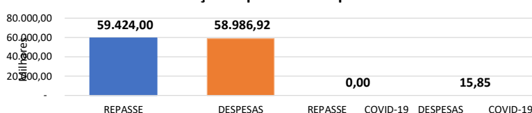
Relação Repasses X Despesas