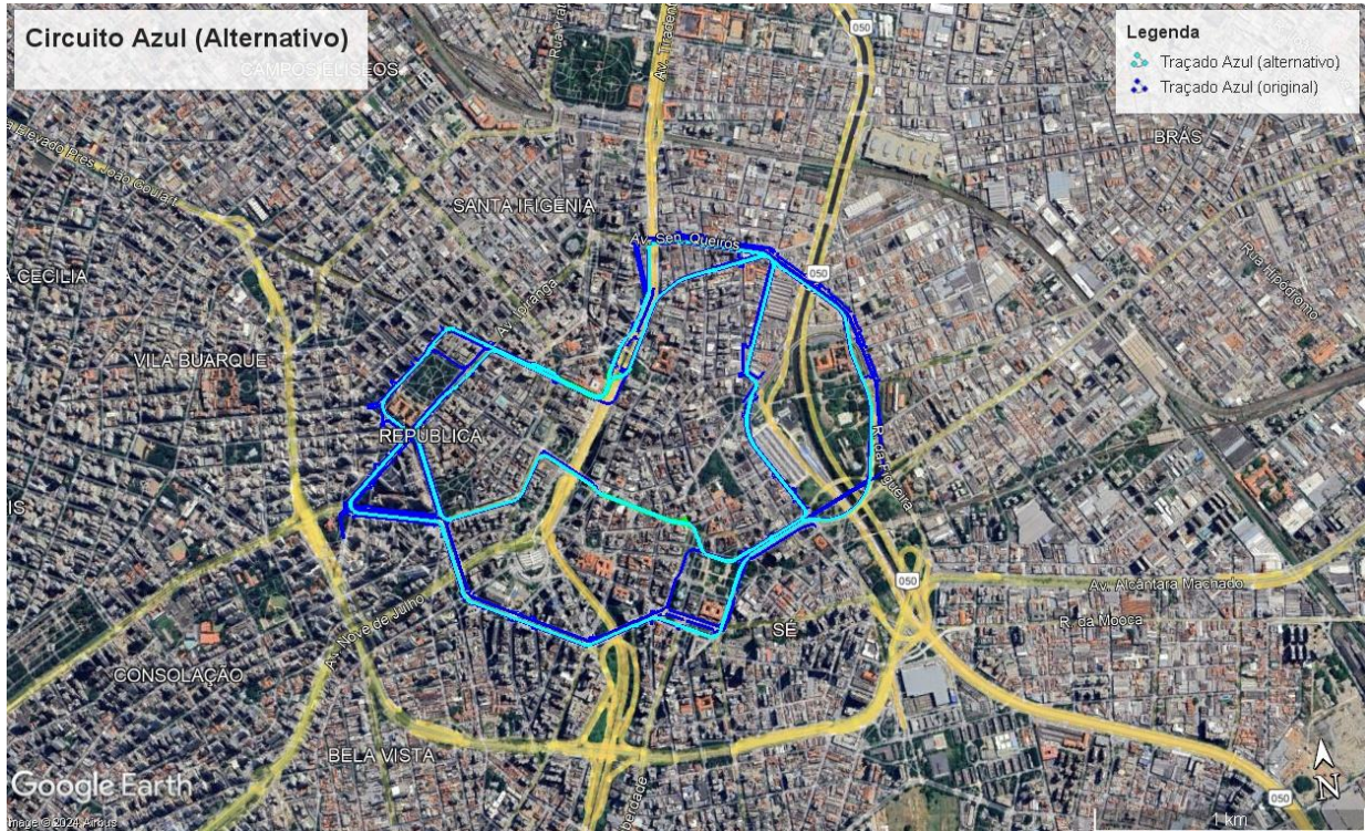
Figura 2 - Delimitação do Circuito Azul (Alternativo)