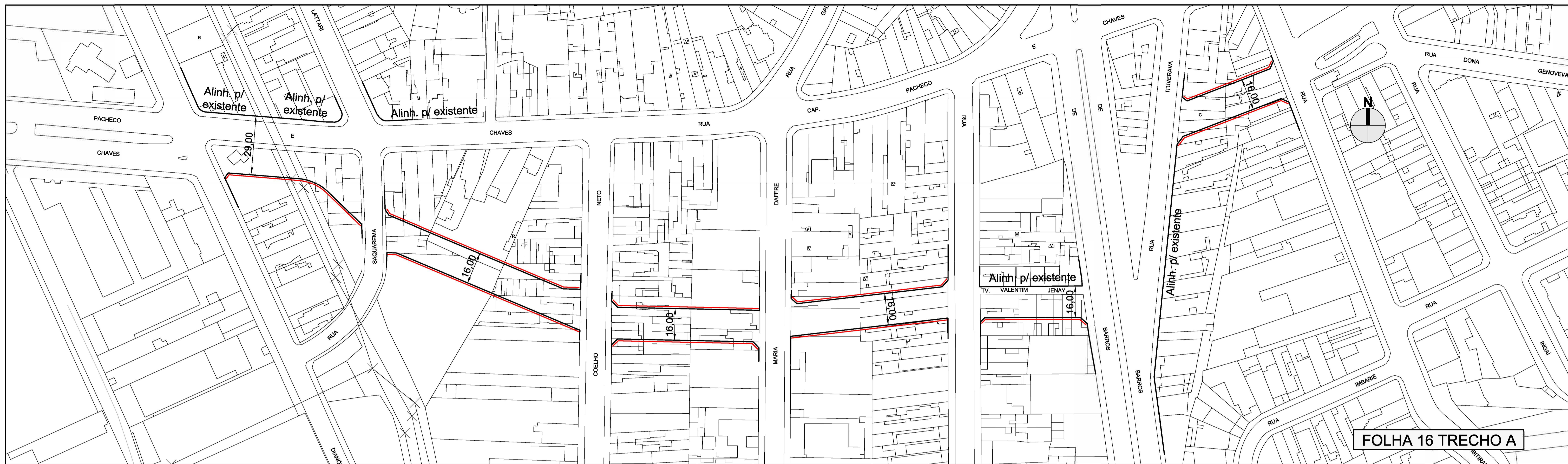
FOLHA 16 TRECHO A