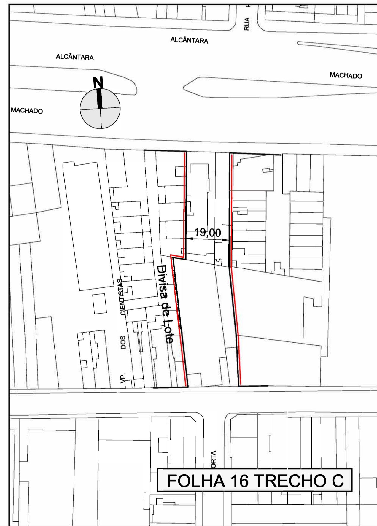
FOLHA 16 TRECHO C